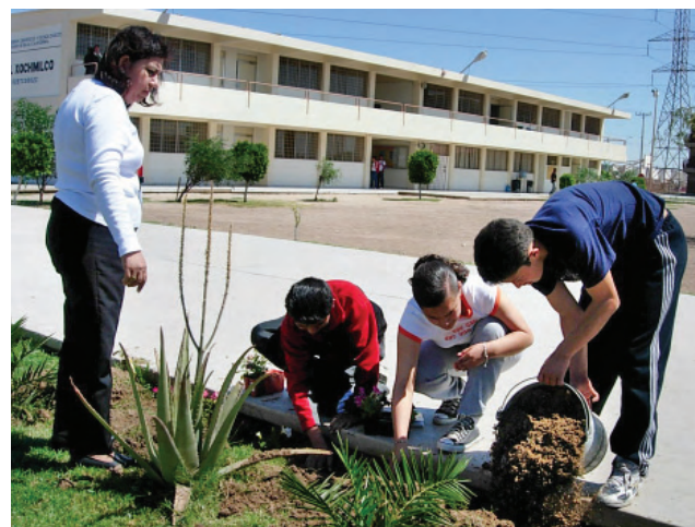
Alumnos en acciones de mejoramiento escolar. CECYTE plantel Xochimilco, Mexicali.

Esta Administración le ha dado relevancia a las acciones que promueven el compromiso del alumno con el quehacer y la problemática cotidiana de su entorno comunitario; dichas acciones están enfocadas a la mejora del medio ambiente o atención a grupos vulnerables de la sociedad (niños y ancianos), así como a tareas de asistencia social.