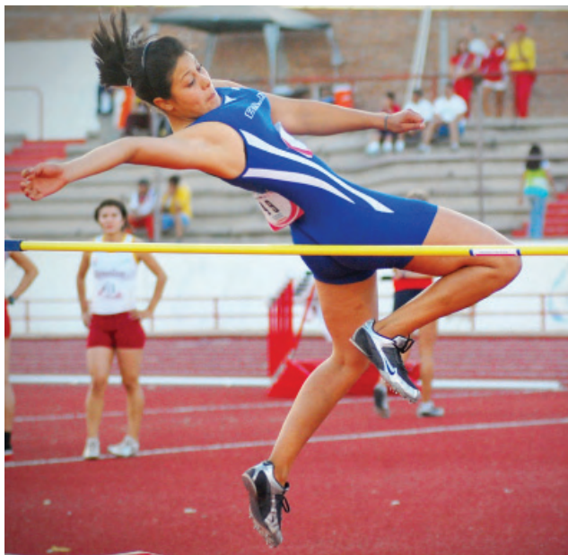
Programa de Detección de Talentos en el Estado.

En el "Programa de Detección de Talentos" de octubre a julio se han evaluado 168 escuelas; 144 primarias y 24 secundarias para un total de 23 mil 265 niños evaluados de los cuales se