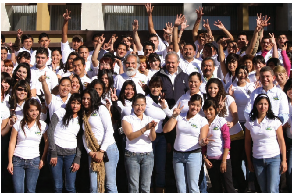
Bienvenida de nuevos cimarrones, UABC.