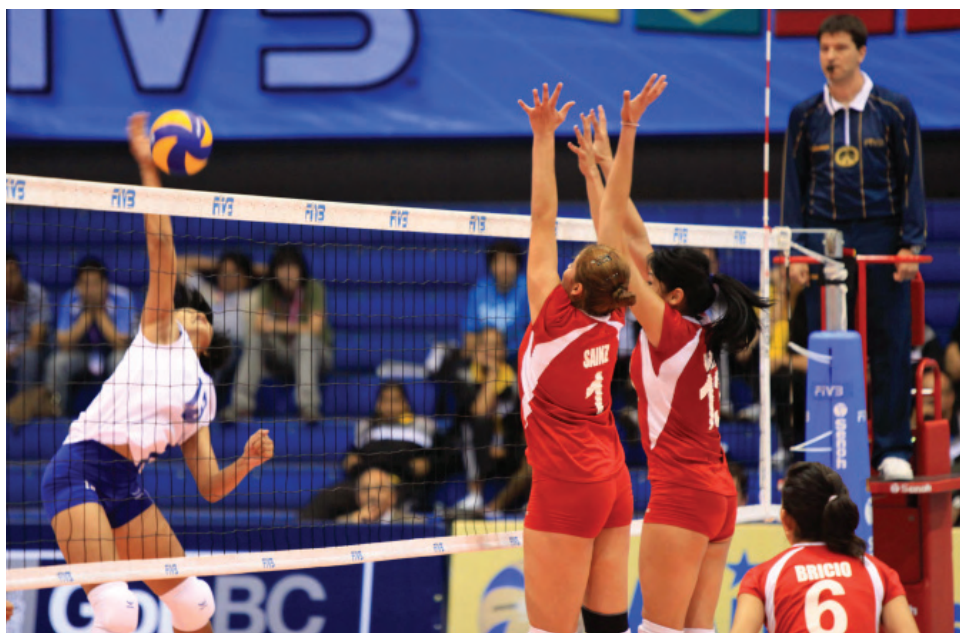
Campeonato Mundial de FIVB, Mexicali y Tijuana.