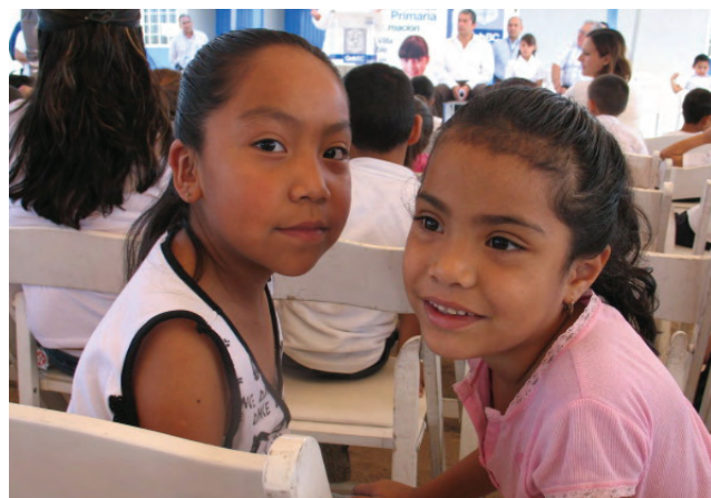
Atención a educación migrante.

El “Programa de Educación Básica a Niñas y Niños de Familias Migrantes”, cubrió el total de solicitudes de servicio en esta modalidad para 21 alumnos de educación inicial, 23 de preescolar y un mil 519 de primaria; que suman un mil 563 alumnos migrantes atendidos. Se