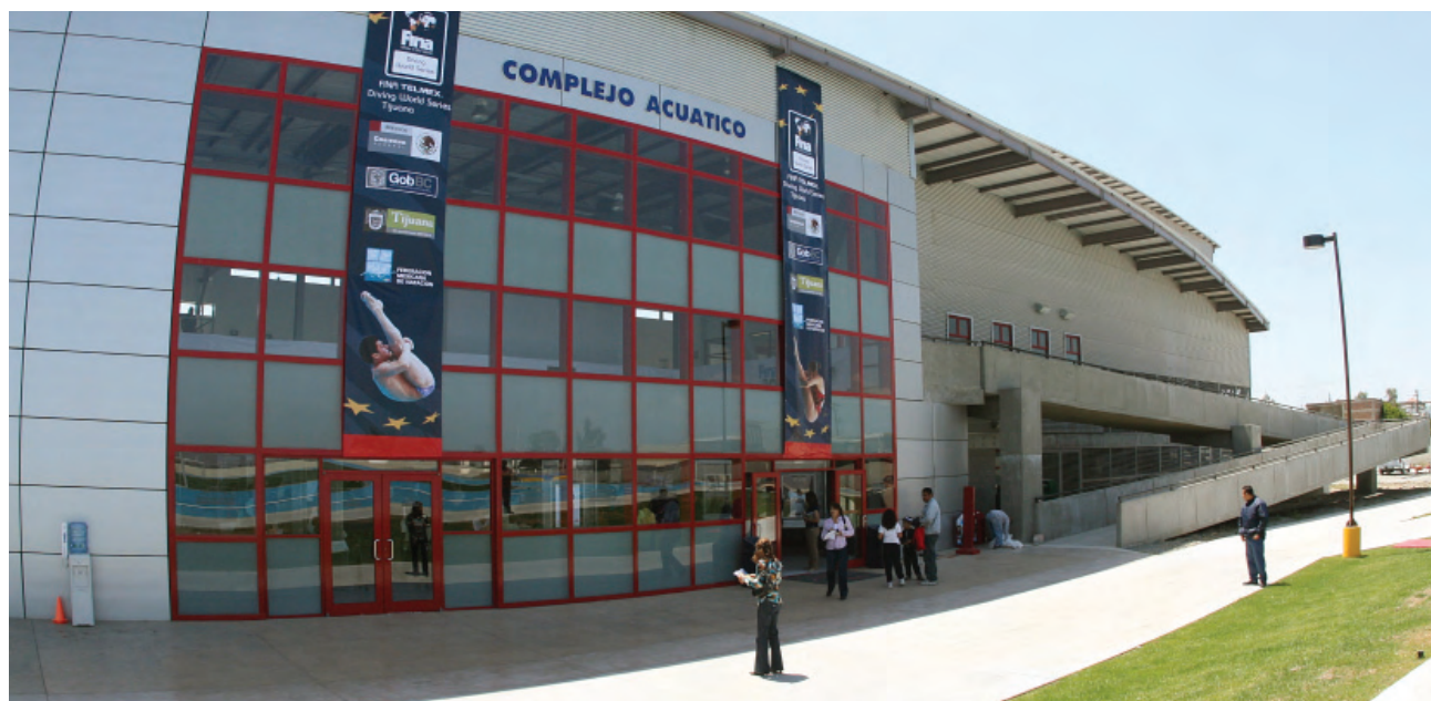
Complejo acuático, CAR Tijuana.

Se continúa la preparación para iniciar con el CAR de Halterofilia en Ciudad Guadalupe Victoria.