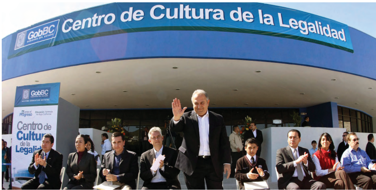
Inauguración del Centro de Cultura de la Legalidad, Tijuana.

En este sentido, el Gobierno del Estado ofrece una serie de programas dirigidos a los docentes, padres de familia y alumnos de educación básica, encaminados a fortalecer el trabajo que se realiza cotidianamente en las aulas para consolidar una educación con calidad, equidad y sentido humano.