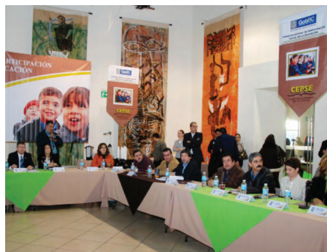
Instalación del CEPSE, Mexicali.

Se proporcionó asesoría en la operatividad a 79 Consejos Sectoriales de Participación Social en la Educación (CSPSE), se realizaron jornadas de capacitación a mesas directivas y directivos, en beneficio de tres mil personas entre directivos, docentes y padres de familia; y se inició el “Programa Estatal de Certificación de los Consejos”. Por otra parte, se instalaron los cinco Consejos Municipales de Participación Social (CMPS) y se inició la instalación del Consejo Estatal de Participación Social en la Educación (CEPSE).