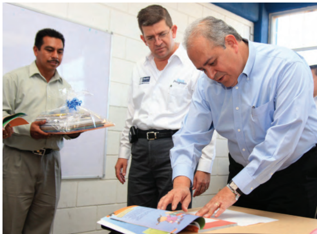
Análisis de resultados de ENLACE.

dictaminar XVII etapa ciclo escolar 2007-2008. Con este recurso y por los resultados obtenidos, se incorporan o promueven los docentes en las diferentes categorías, y reciben un estímulo económico que incrementa su salario.