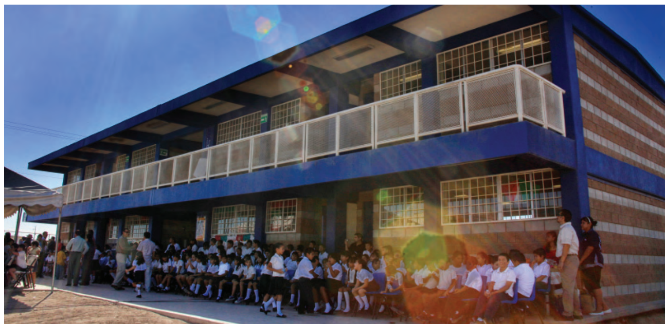
Programa de Mantenimiento Correctivo a Planteles Escolares.

Estos se dirigen principalmente a los alumnos de educación migrante, indígena y especial, ya que la entidad tiene una población escolar de 114 mil 230 educandos, en contextos vulnerables de alta migración, extraedad, bajo rendimiento, multigrado, factores de riesgo de calle y de familias de jornaleros agrícolas