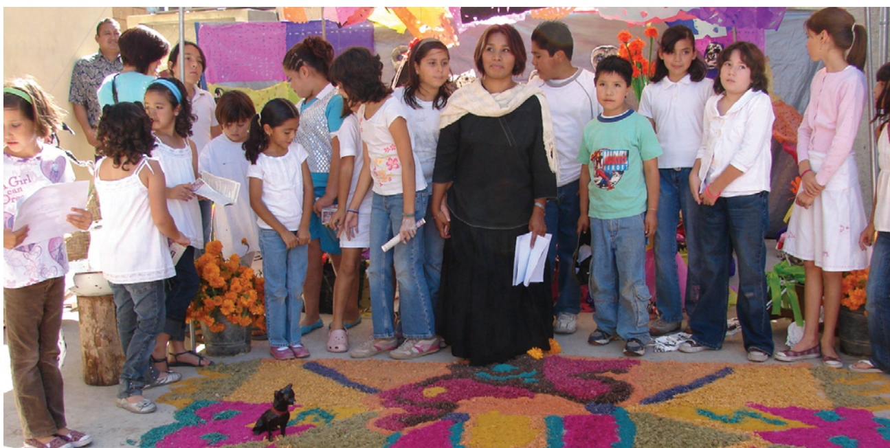
Conservación de tradiciones y cultura popular de Baja California.

Se contribuyó a la difusión y conservación de las tradiciones de las etnias nativas y migrantes con 26 actividades en Mexicali, nueve en Tecate, 18 en Tijuana, 10 en Playa de Rosarito, siete en Ensenada y 10 en San Quintín, en beneficio de 31 mil 135 personas. De los cuales, seis mil 194 son de Tecate, cuatro mil 500 de Tijuana, 282 de Playas de Rosarito, 759 de Ensenada y 19 mil 400 de San Quintín. Se apoyaron 10 proyectos de calidad por medio del "Programa de Apoyo a la Cultura Municipal y Comunitaria" (PACMYC). Asimismo se