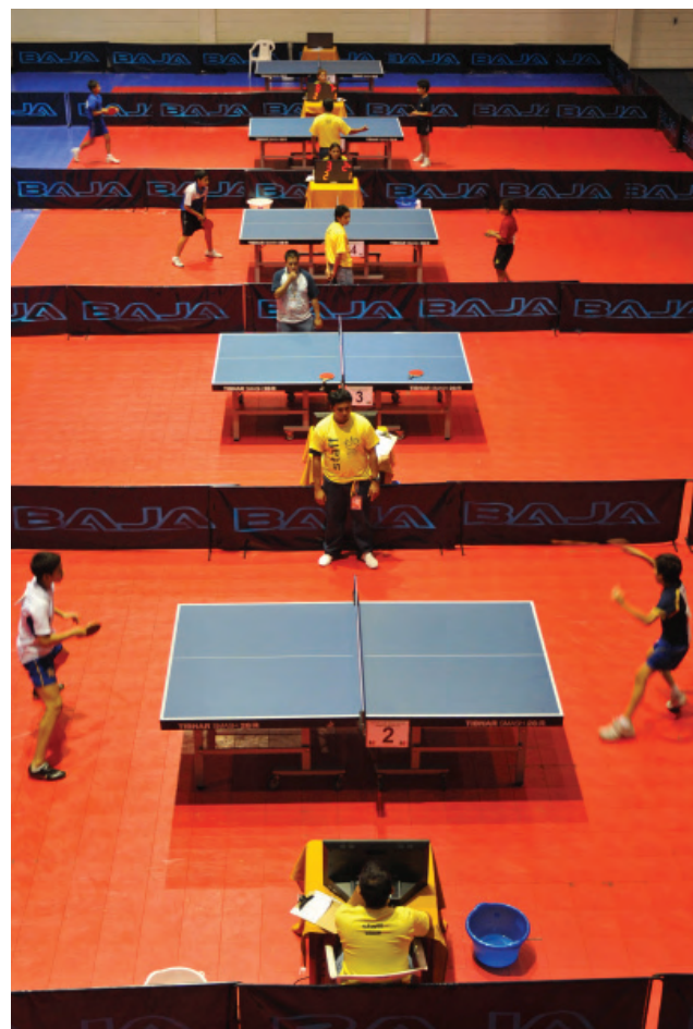
Equipamiento tenis de mesa.

De igual manera, se incrementó el parque vehicular con la adquisición de dos autobuses y siete vehículos tipo van de 12 pasajeros con una inversión de 7 millones de pesos.