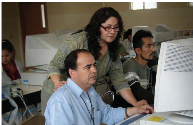
Capacitación sobre el nuevo modelo de gestión escolar.

Con el objeto de mejorar la calidad de la educación en México, se llevó a cabo el Concurso Nacional de Asignación de Plazas Docentes, correspondiendo al Estado de Baja California 602 plazas y cuatro mil 884 horas, con una participación de seis mil 612