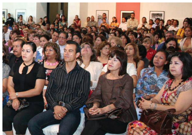
Taller “Competencias para el México que Queremos”.

Se distribuyeron cuatro mil ejemplares del documento “Modelo de Gestión Escolar en Baja California”, y se capacitó en la implementación y operación del modelo a dos mil 408 directores, 272 supervisores e inspectores, 11 jefes de sector, nueve jefes de enseñanza y 753 ATP's. En total, tres mil 453 integrantes de la estructura operativa en educación básica.