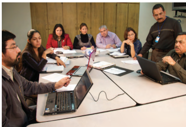
Capacitación sobre manejo de programas de estudio y estrategias pedagógicas.

(UABC), institución externa que garantiza la imparcialidad de los resultados, así mismo, se integraron seis grupos colegiados por área de conocimiento: ciencias naturales y exactas, ciencias de la salud, ciencias agropecuarias, ciencias sociales y administrativas, educación y humanidades y por último en ingeniería y tecnología para analizar los contenidos curriculares entre educación básica, media superior y superior y lograr promover un sistema educativo articulado y lineal.