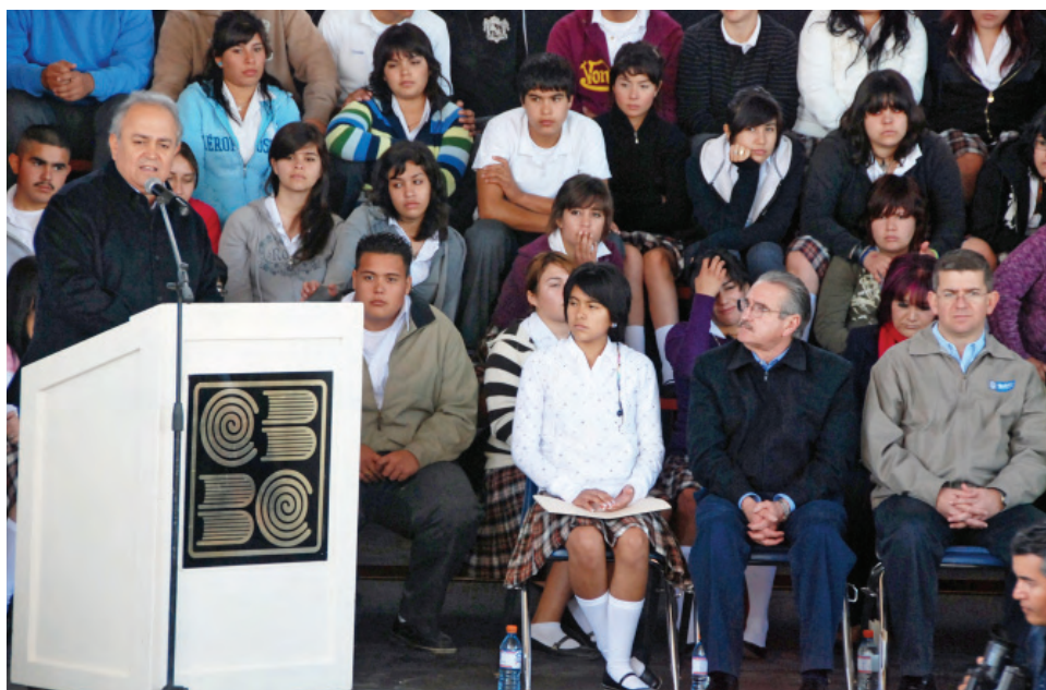
Educación centrada en valores.

Los resultados de la prueba ENLACE 2009 aplicado en educación media superior, indica que Baja California obtuvo el séptimo lugar en los niveles de dominio suficiente, bueno y excelente en Habilidad Lectora y tercero en Habilidad Matemática respecto al doceavo y quinto respectivamente logrados en 2008.