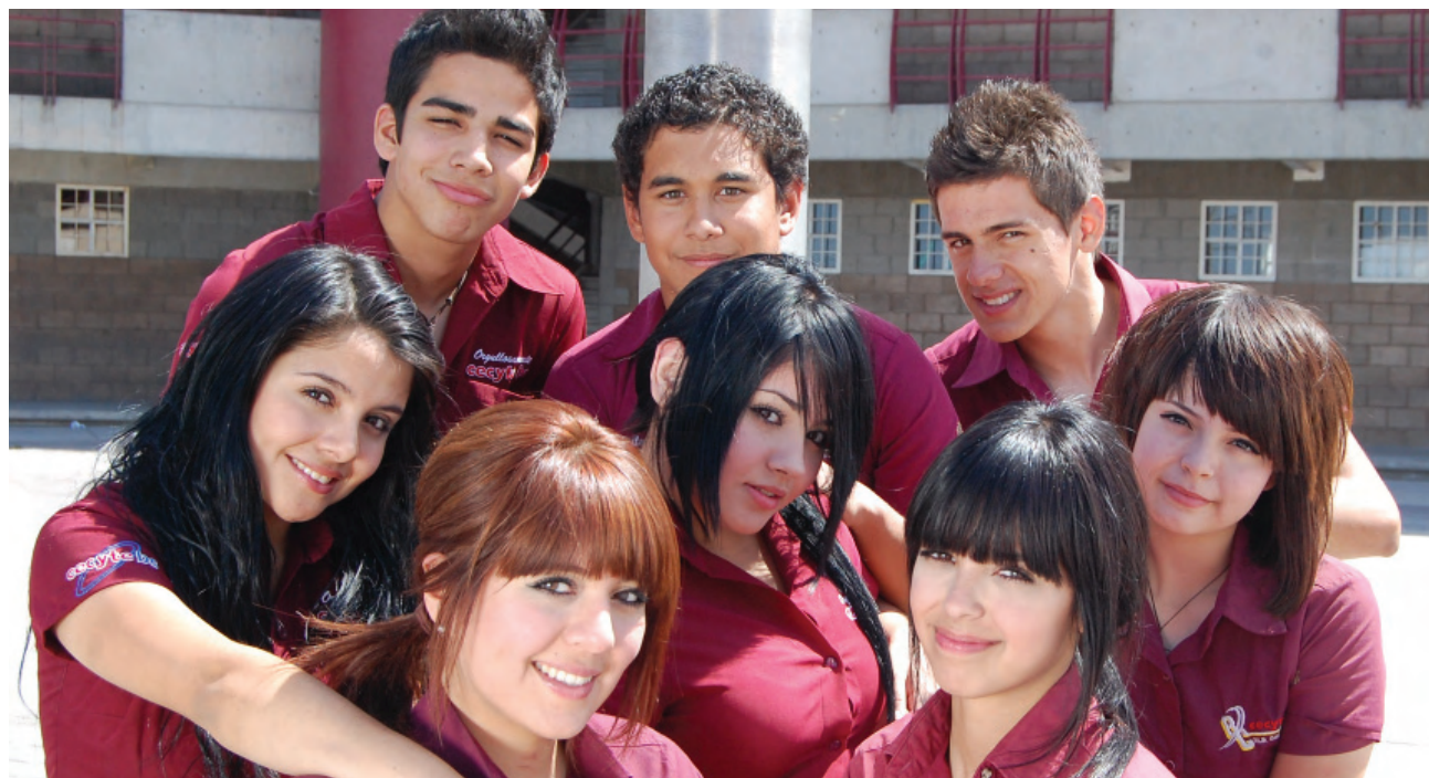
Alumnos del CECYTE Plantel Xochimilco, Mexicali.

En este sentido, es fundamental incrementar la cobertura de la población en edad de cursar este nivel y mejorar los índices de absorción de los alumnos que egresan de secundaria en educación media superior. Son aspectos que exigen esfuerzos significativos para proporcionar una educación integral y de calidad.