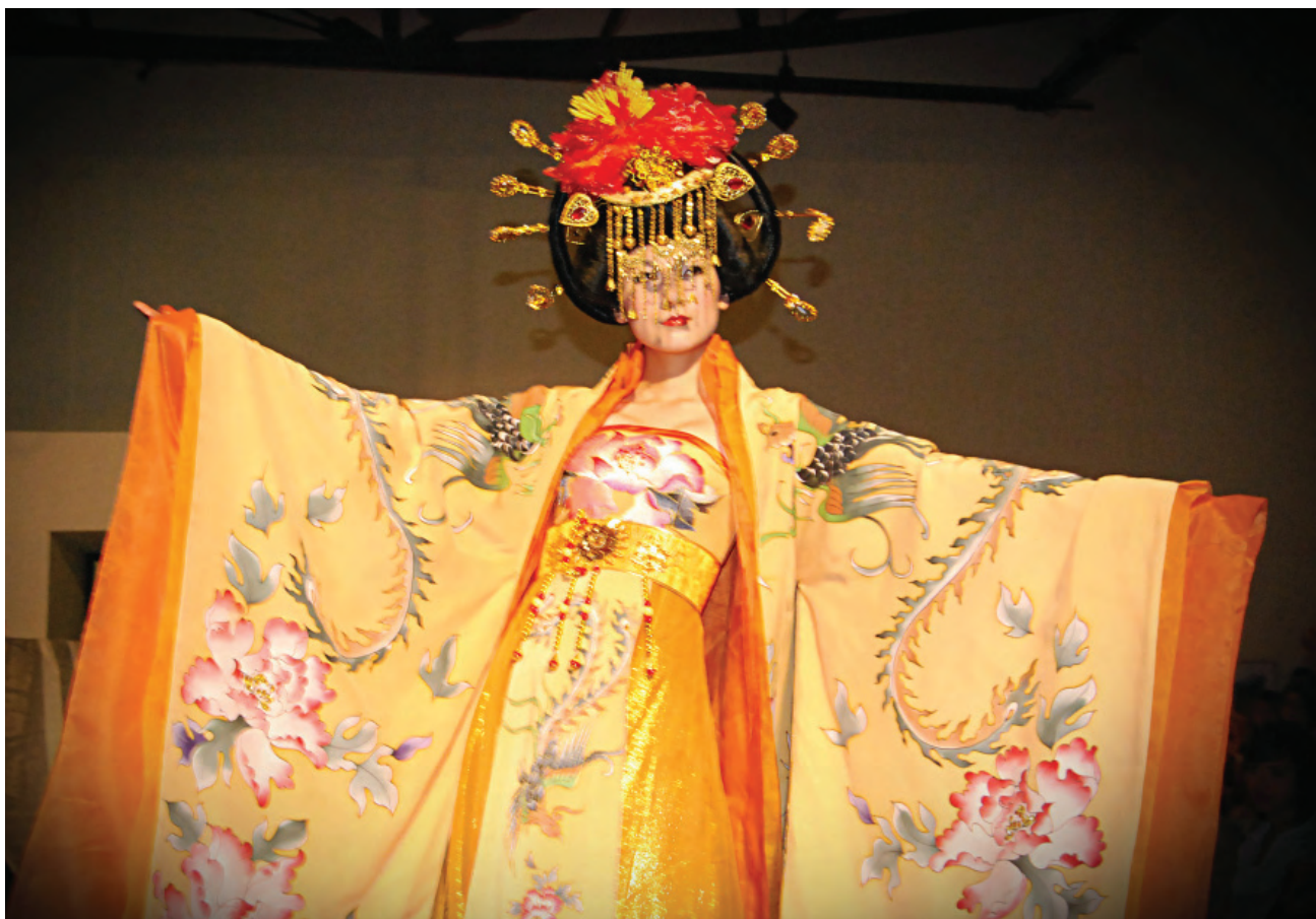
Festival de China en Baja California.