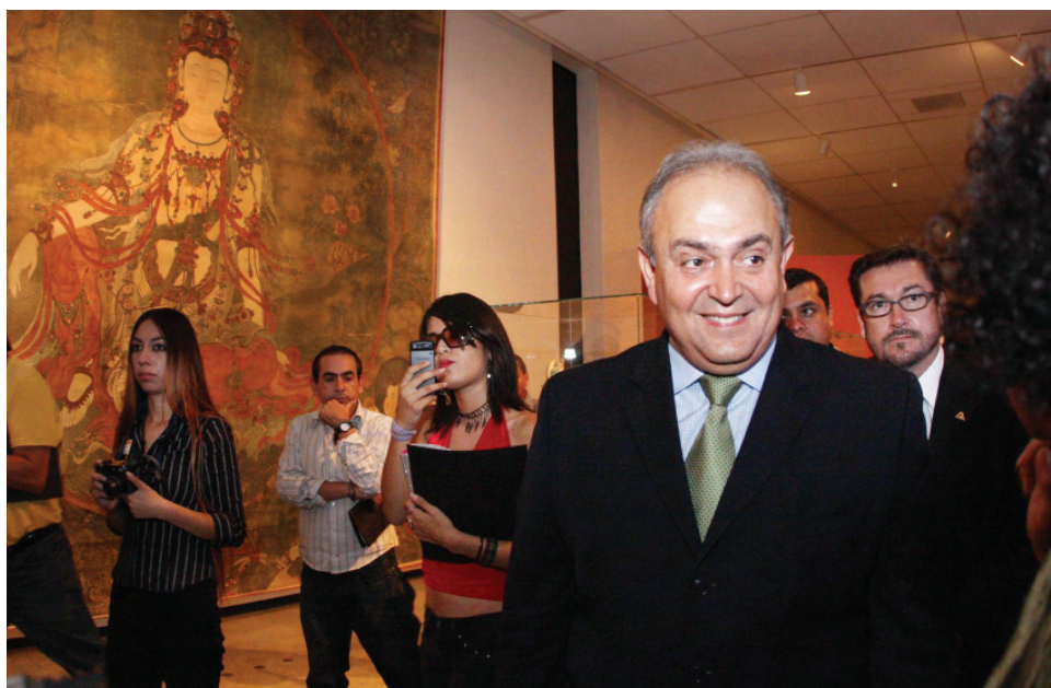
Acceso a la cultura.