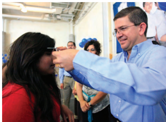
Programa “Ver Bien para Aprender Mejor”.

Con el “Programa Ver Bien para Aprender Mejor”, se distribuyeron cinco mil 207 pares de lentes a niños y jóvenes de preescolar,