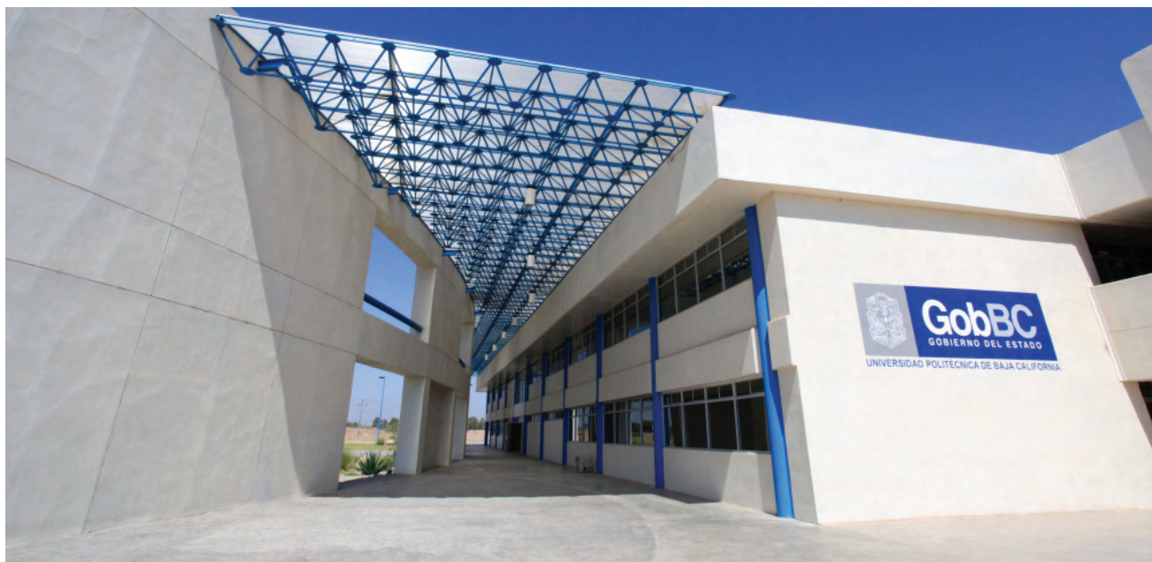
Infraestructura y equipamiento en UPBC.

En la UTT se invirtieron 85 millones 249 mil 543 pesos, sobresaliendo acciones como el inicio en la construcción del edificio académico y otro de laboratorios, para la apertura de la unidad ubicada en el Municipio de Ensenada, el edificio para rectoría y la adecuación de aulas para ofertar licenciaturas.