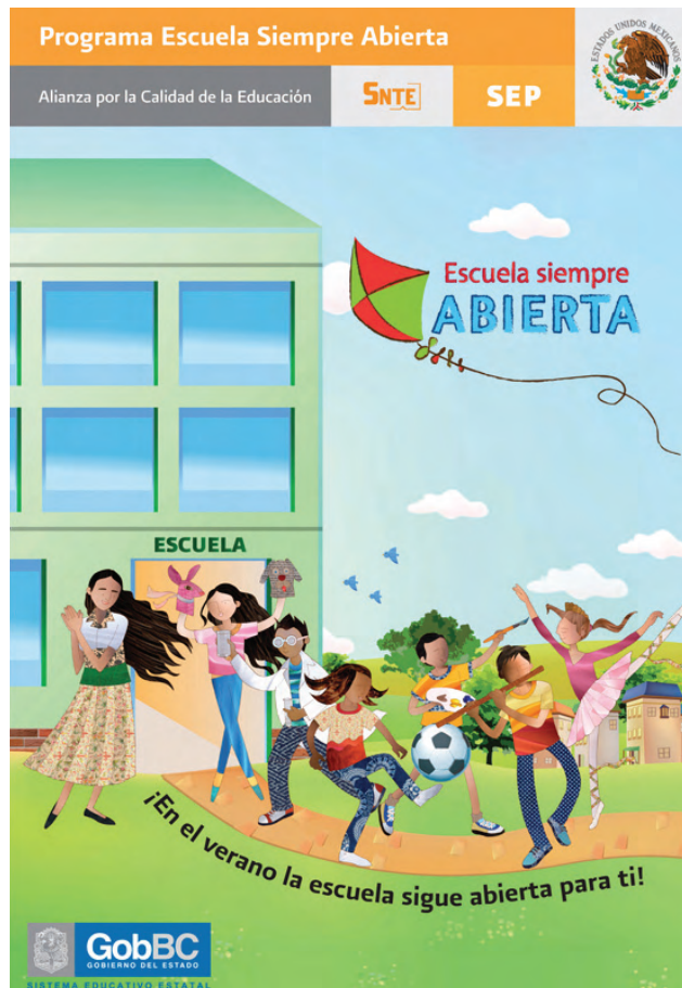
Programa Escuela Siempre Abierta.

En la etapa de capacitación de los Cursos Estatales de Actualización (etapa XVIII), se establecieron 401 colectivos docentes. En total son un mil 511 colectivos que priorizan el trabajo colaborativo como estrategia de capacitación.