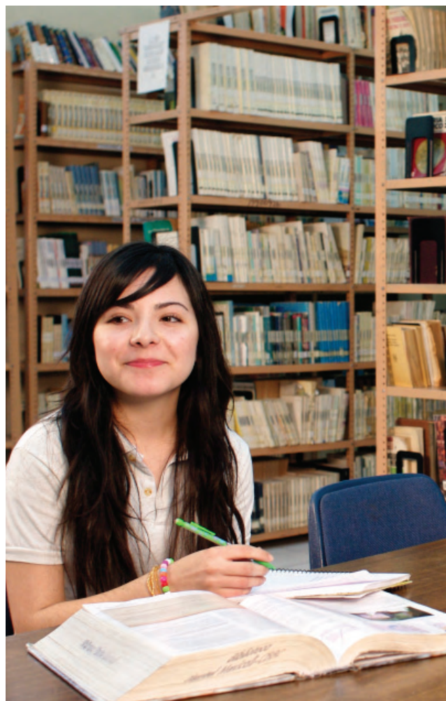
Alumna bajacaliforniana evaluada en la prueba ENLACE.

Es de suma importancia lograr la pertinencia de la oferta educativa del nivel y promover la definición de un solo perfil del egresado con la participación del sector social y productivo. Esto permite garantizar la congruencia y eficacia de la oferta educativa con los escenarios económicos y sociales que se desarrollan en el Estado.