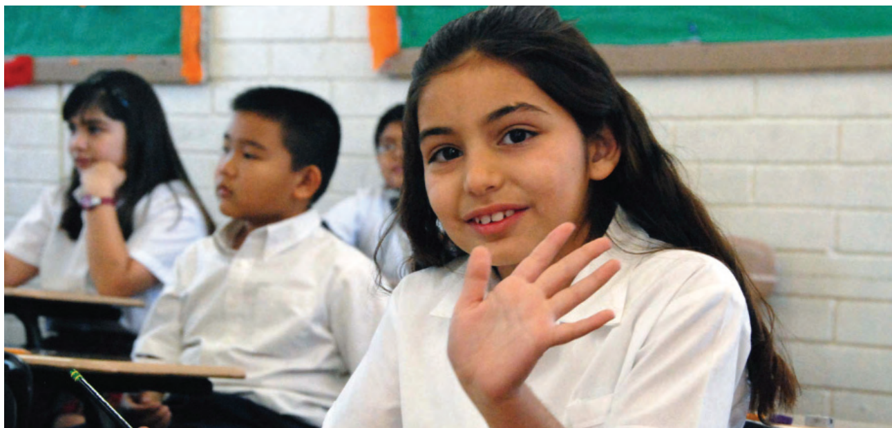
Aplicación prueba ENLACE.

Derivado de lo anterior, se capacitó a los equipos de ATP's del área de español, de los cinco municipios, en la comprensión y diseño de reactivos propios de la asignatura, para que lo replicaran con los docentes de tercer grado de secundaria.