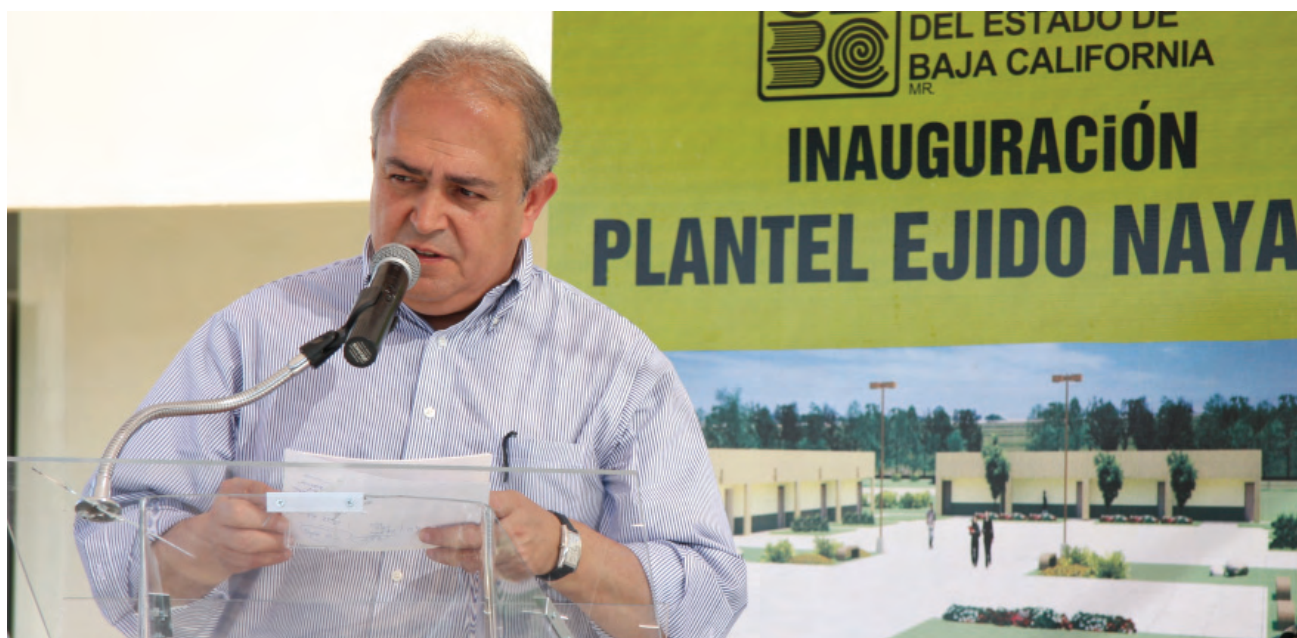
Inauguración del COBACH plantel Ejido Nayarit, Mexicali

En este periodo el COBACH refrendó ocho certificaciones ISO 9001:2000 en diferentes planteles y sus oficinas centrales, tanto