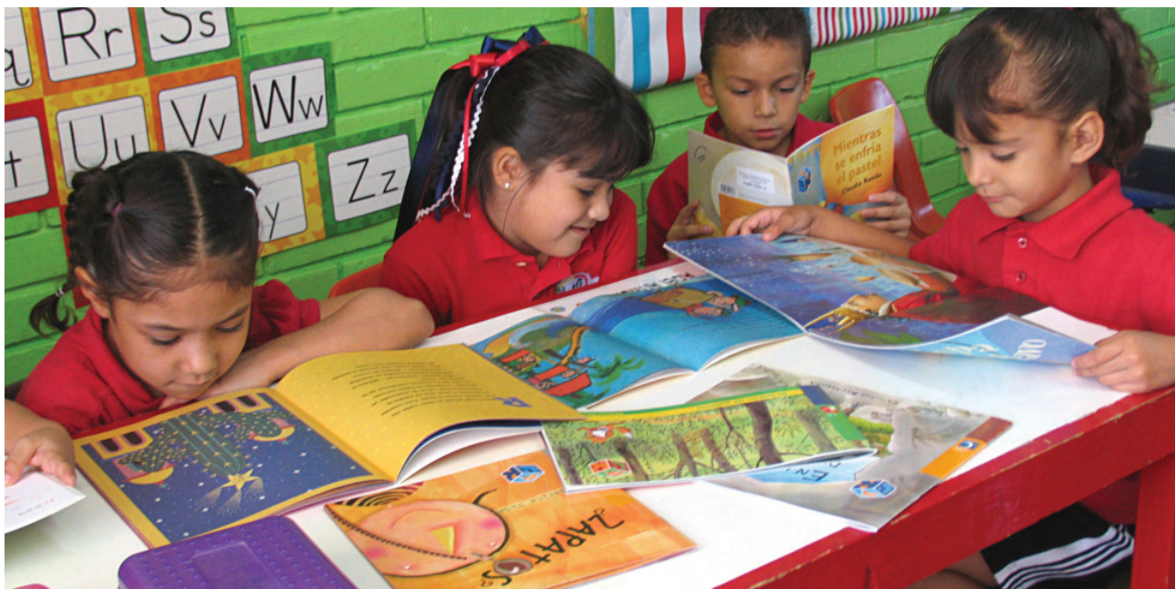
Fortalecimiento en la educación inicial.

Con estos equipos se atendieron seis jefaturas de sector, 133 inspecciones-supervisiones, 802 ATP’s, un mil 434 directores y cuatro mil 647 docentes de primero y sexto grado de educación primaria, correspondiendo al 47.39 por ciento de los docentes del nivel educativo. Estos últimos como asistentes a un taller de inducción para la generalización del proceso de reforma con el “Trayecto formativo del PRIEB 2009 en Baja California” en su primera fase, así como con el diplomado “Reforma Integral de Educación Primaria”, en coordinación con la Universidad Pedagógica Nacional (UPN) y las escuelas normales.