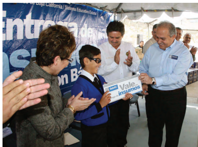
Entrega de Vales de Insumos.

El crecimiento de la matrícula en el presente ciclo escolar en comparación al anterior