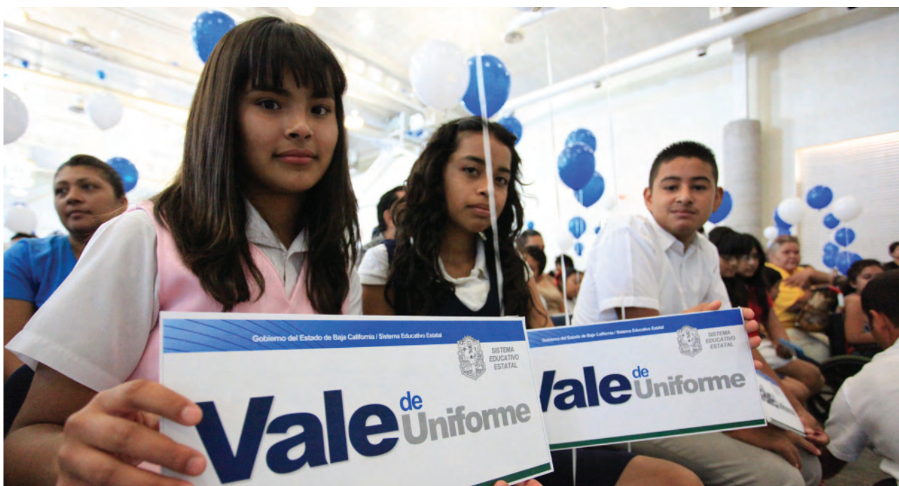
Entrega de “Vale de Uniforme”.

Se entregó además un apoyo económico, derivado de la campaña estatal de la donación de armas de fuego y explosivos, consistente en 2 mil pesos por un canje de arma en el Municipio de Ensenada. Se otorgaron 110 becas para madres jóvenes y jóvenes embarazadas