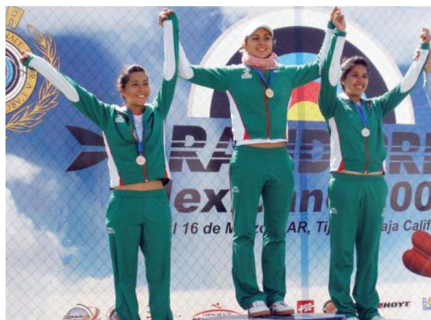
Medallistas de tiro con arco.

Se llevó a cabo el Campeonato Mundial de Voleibol Femenil 2009, donde deportistas bajacalifornianos tuvieron participación en el representativo mexicano quedando en el octavo lugar del mundo de la categoría, evento que reunió a los mejores 16 equipos del mundo como Cuba, Brasil, China, Alemania, Dominicana Bulgaria, Holanda, USA, Tailandia, China Taipei, Polonia, Kenia, Colombia, Turquía y México.