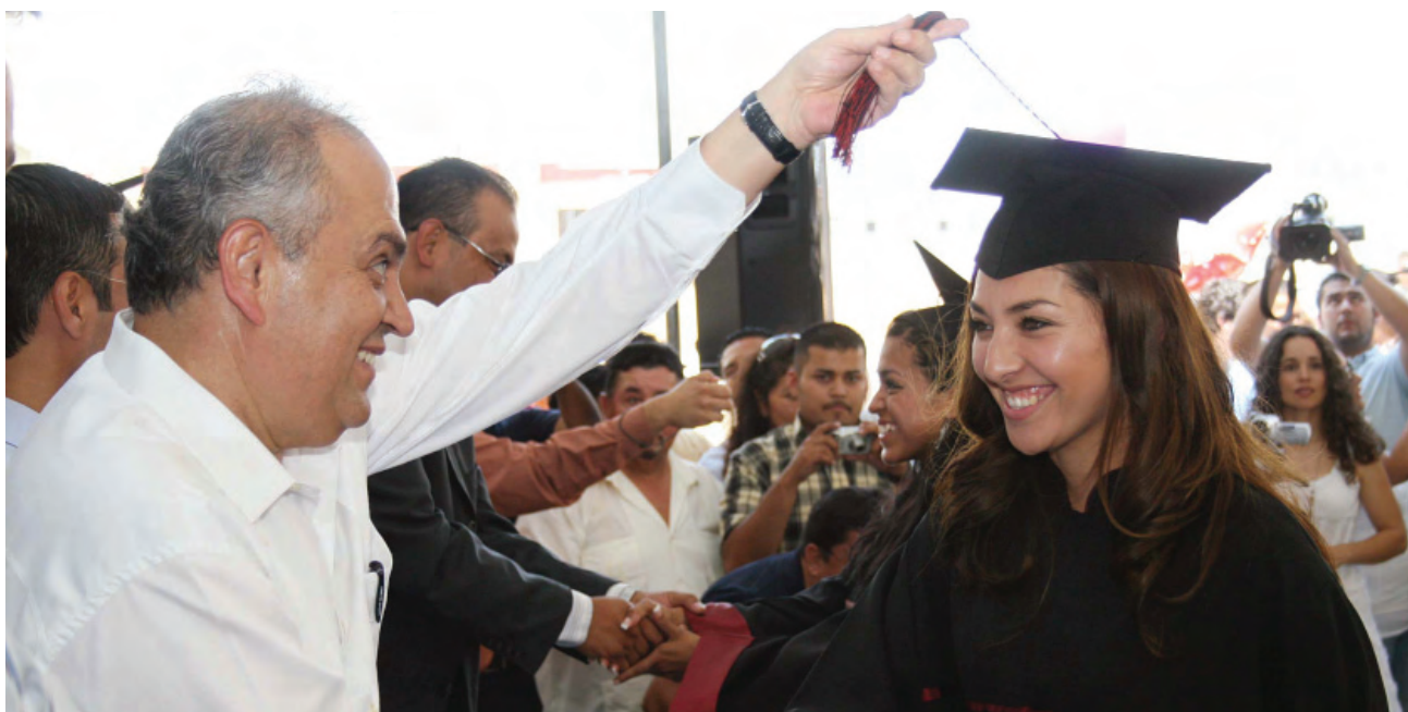
Eficiencia terminal en bachillerato.

Es fundamental impulsar acciones para mejorar la calidad educativa del nivel, a través de la mejora en la gestión educativa para lograr un impacto significativo en los procesos de enseñanza y aprendizaje. Para tal efecto se realizan acciones de planeación institucional con la finalidad de mejorar los indicadores educativos y actividades de actualización y capacitación docente para mejorar las estrategias pedagógicas, encaminadas en el marco de la Reforma Integral de la Educación Media Superior, impulsada por la SEP.