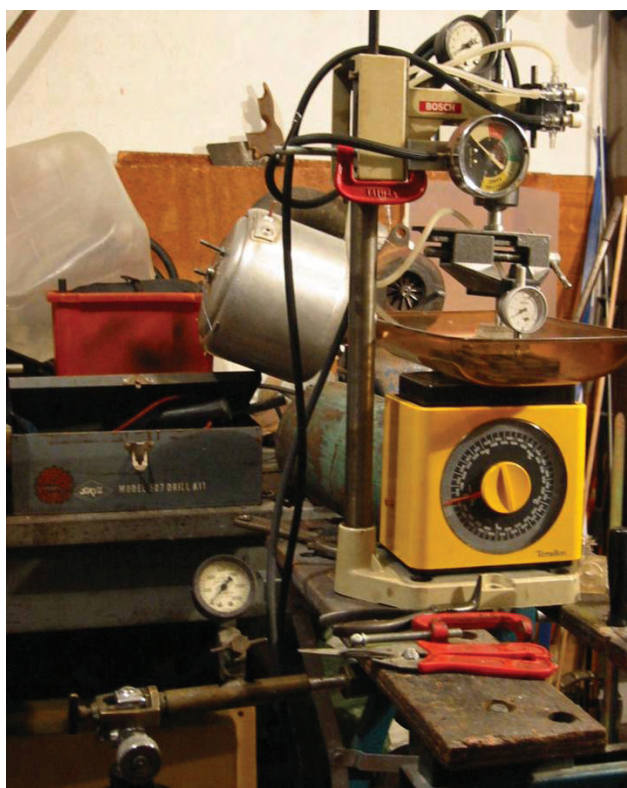
Impulso a la investigación e innovación tecnológica.

La presente Administración impulsa la creación de nuevos programas de posgrado que permitan incorporar a un número mayor de alumnos que cursa alguno de estos programas, es decir, promueve la investigación a través de