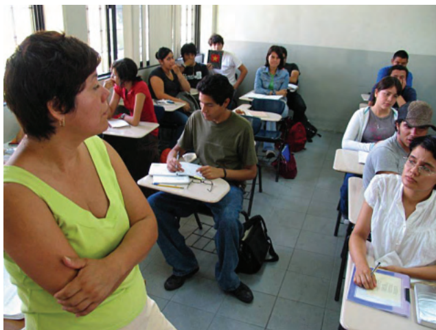
Aplicación de EXHCOBA a alumnos de nuevo ingreso.

Para dar certeza a lo anterior, además de contar con procesos de evaluación confiable que promuevan la mejora de los resultados académicos, se desarrollaron tres acciones sustantivas: se aplicó el Examen de Habilidades y Conocimientos Básicos (EXHCOBA) a 690 alumnos de nuevo ingreso de la UABC por