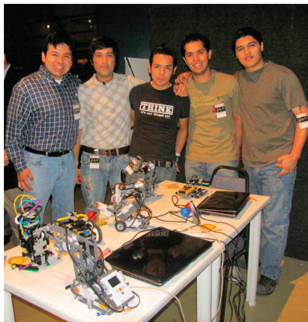
Fortalecimiento del proceso enseñanza-aprendizaje.

La vinculación educativa brinda los elementos y experiencias de aprendizajes indispensables para fortalecer los procesos formativos a través de la resolución de problemas reales surgidos en los sectores social y productivo de la entidad. En este sentido, en Baja California se promueve una articulación congruente entre el sector educativo y los sectores social y productivo para formar generaciones de profesionistas que permitan potenciar la economía del Estado.