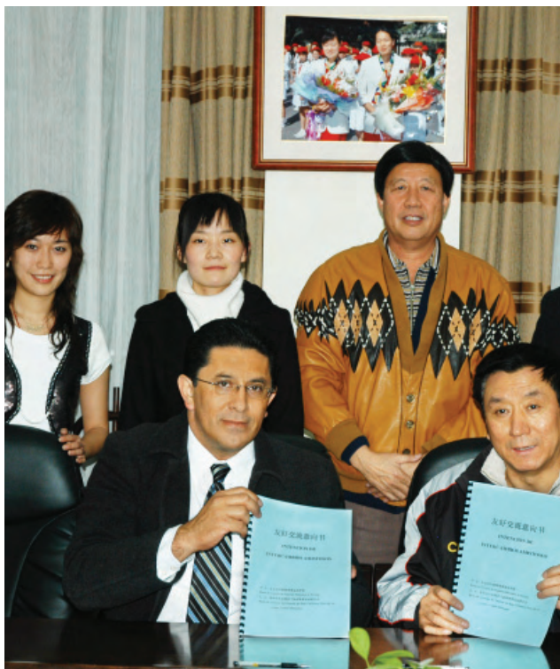
Convenio con la República Popular de China para intercambio deportivo.

Durante el presente año, se ratificó el convenio de colaboración que se tenía con la República de Cuba a través de Cuba Deportes, además de permanecer en el intercambio con países como China, España, Corea, USA, Puerto Rico y República Dominicana con el objetivo principal del intercambio deportivo de atletas y entrenadores, así como establecer un compromiso con países que en materia de desarrollo deportivo vayan a la vanguardia y que brinden una oportunidad importante de crecimiento para el deporte local en Baja California y en México. Las disciplinas deportivas priorizadas dentro de estos acuerdos son: tenis de mesa, clavados, atletismo, tiro con arco, halterofilia, gimnasia artística, voleibol, tae kwon do, baloncesto, gimnasia trampolín, tiro deportivo así como la preparación física y el boxeo.