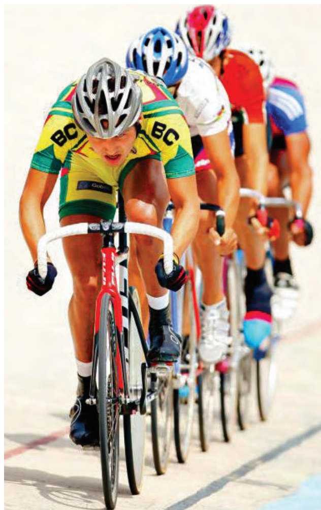
Desarrollo de talentos deportivos. Prueba de ciclismo.

Se realizaron Campamentos Internacionales en Cuba, China, Corea, USA, España, Canadá y México con una participación de 850 atletas en las disciplinas deportivas de voleibol, básquetbol, tenis de mesa, tiro con arco, natación, remo, gimnasia artística, clavados, levantamiento de pesas entre otros, con esta preparación se fortalecieron los resultados exitosos de la Olimpiada Nacional 2009.