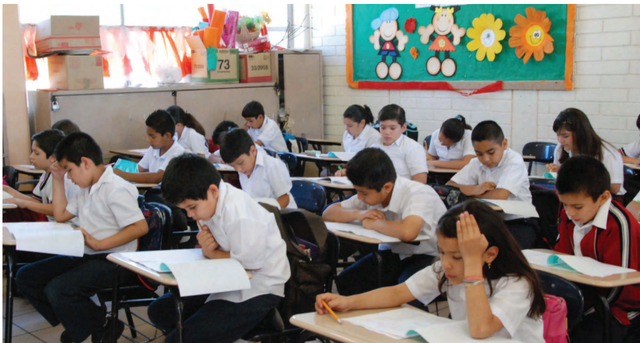
Aplicación examen PISA en el Estado.

En el caso de carrera magisterial, se inscribieron 20 mil 138 docentes para evaluarse en la XVII etapa ciclo escolar 2008-2009. A la vez, la Comisión Nacional SEP-SNTE autorizó a esta entidad, 16 millones 25 mil pesos para