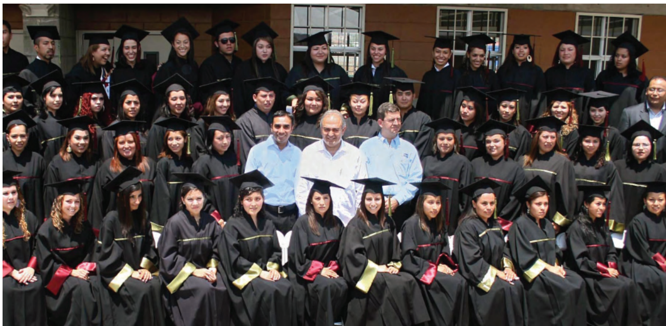
Egresados de la Escuela Normal Fronteriza, Tijuana.

En virtud de lo anterior, se registró una eficiencia terminal del 41 por ciento de alumnos que concluyeron satisfactoriamente