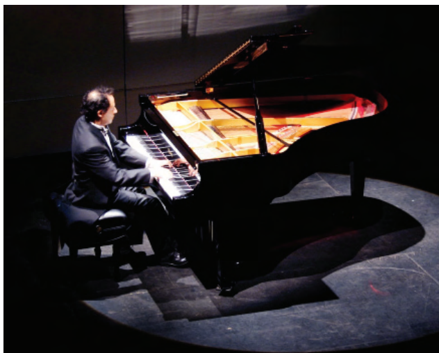
VII Edición del Festival de Octubre.

Se implementaron estrategias para mayor captación de público en actividades artísticas y culturales utilizando medios electrónicos e impresos. En el periodo que se informa 783 mil 702 habitantes disfrutaron de la amplia oferta de servicios culturales y artísticos, correspondiendo 279 mil 758 habitantes de Mexicali, 102 mil 87 de Tecate, 86 mil 310 de Tijuana, 37 mil 602 de Playas de Rosarito, 118 mil 578 de Ensenada, 26 mil 544 en San Quintín y 132 mil 823 de distintas regiones del país.