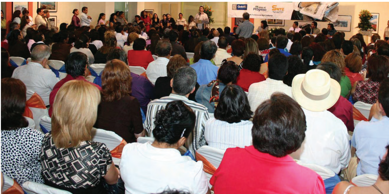
Sensibilización de agentes educativos sobre el modelo de atención con enfoque integral.

Por otra parte, se distribuyeron a un mil 354 escuelas 10 mil 445 libros que corresponden a la “Colección Reforma Integral de la