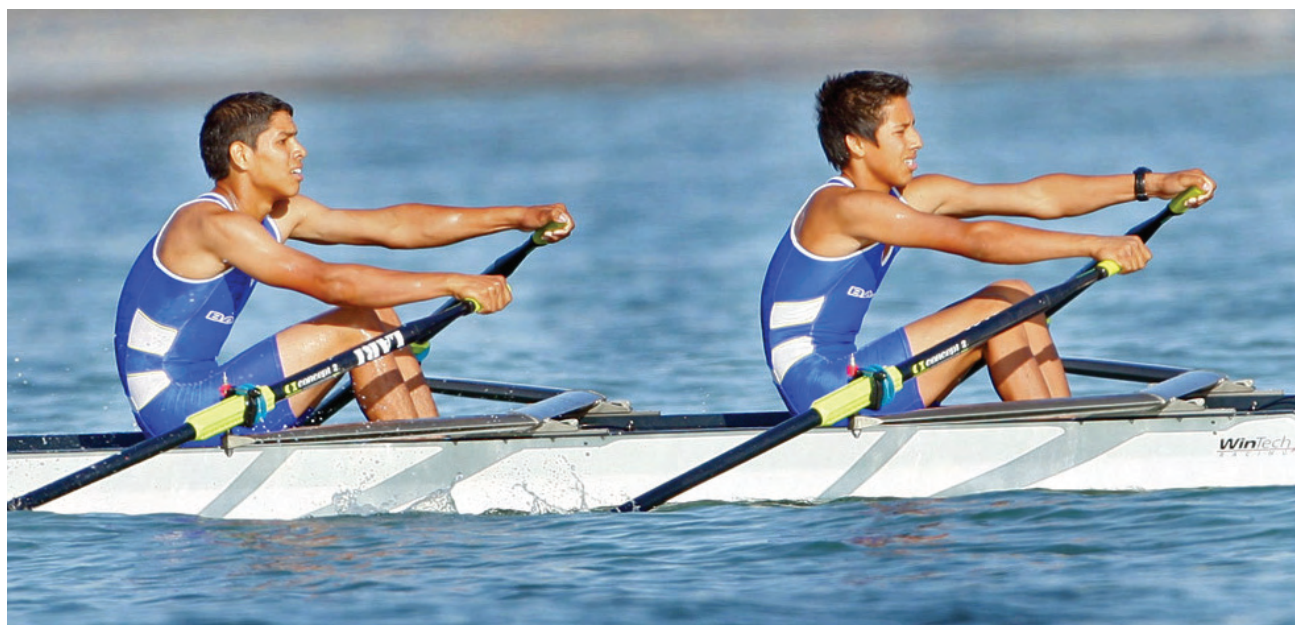
Seleccionados bajacalifornianos en remo; Olimpiada Nacional 2009.

El CAR de Baja California brinda la oportunidad de recibir selecciones nacionales de México y otros países que permiten a atletas locales y entrenadores, un intercambio y experiencia de primer nivel técnico deportivo, a su vez que permite a los deportistas locales, desde su etapa de prospectos, experimentar en espacios y con equipamiento de óptima calidad, aquí es importante apuntar que cada vez es mayor el número de selecciones nacionales que se concentran en el Estado y que permiten un desarrollo e intercambio de primer nivel a los atletas, como fue: la selección de clavados de México, la cual realizó campamento de preparación en el Complejo Acuático del CAR del dos al 10 de junio del este año. Los equipos de voleibol de playa femenino y varonil que participaron en el Circuito Mundial de Voleibol de Playa SWATCH-FIVB 2009, realizaron campamento de preparación del primero al 17 de junio en las instalaciones de voleibol de playa y gimnasio de preparación física del CAR. La concentración de las