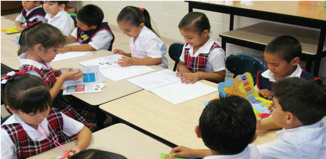
Atención de alumnos en situación de vulnerabilidad.

ciento. Así como el 89 por ciento, equivalentes a 41 escuelas de educación especial, además de 135 centros de trabajo de apoyo a la educación (USAER, CRIE y CAPEP).