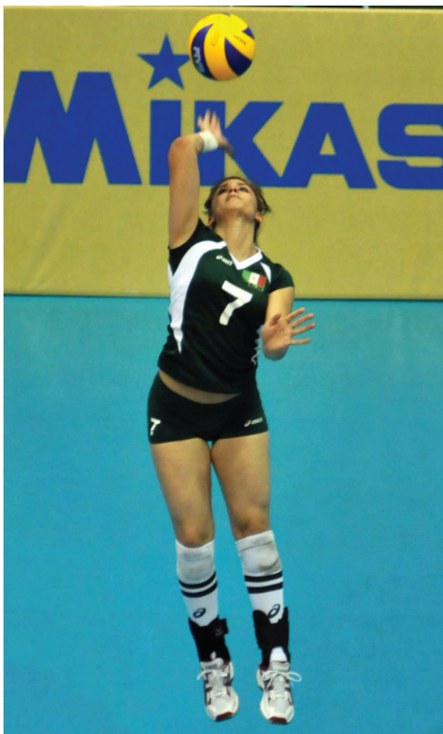
Evento Copa Baja de Voleibol.

de carácter regional congregó a más de 100 ciclistas de toda la península dentro de las tres modalidades de ciclismo ruta, llevada a cabo en el corredor 2000 Tijuana-Rosarito; la pista se llevó a cabo en el Velódromo del CAR y la parte de montaña en la zona de la Presa en Tijuana.