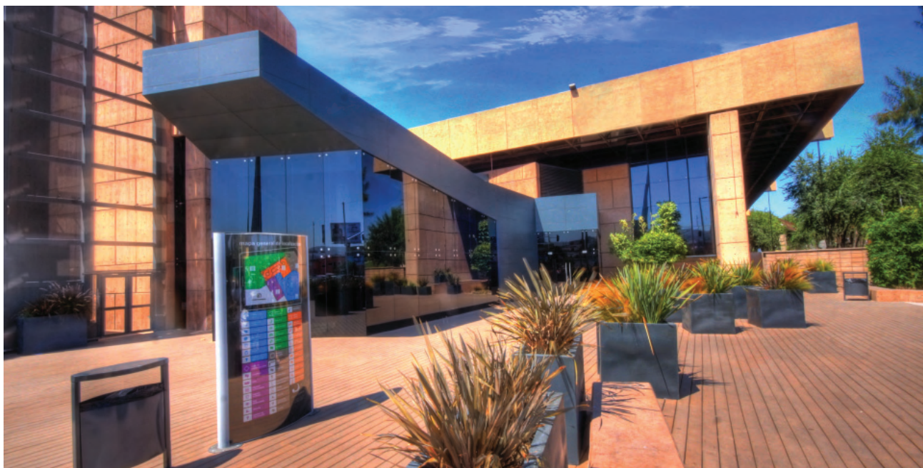
Espacio alternativo, edificio de El Cubo, Tijuana.

y jóvenes duplicó el apoyo económico pasando de 3 a 6 millones de pesos para el "Programa Talentos Artísticos, Valores de Baja California", que en su segunda convocatoria presentó un incremento del 38 por ciento en las solicitudes de ingreso en referencia al primer año llegando a 654; de las cuales fueron seleccionadas 235 y se da continuidad a 97 de la convocatoria anterior, para un total de 332 niños y jóvenes talentos artísticos detectados. De los cuales, 91 son de Mexicali, 27 de Tecate, 111 de Tijuana, 11 de Playas de Rosarito, 86 de Ensenada y seis de San Quintín.