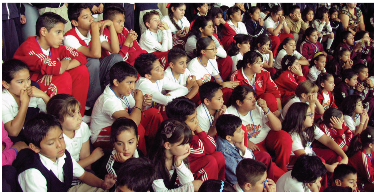
Alumnos en taller “Hábitos de Estudio”.

A fin de disminuir los índices de delincuencia y el consumo de drogas, se atendió a tres mil 389 alumnos en 10 escuelas de educación básica con el proyecto “Espacios Educativos-Espacios Deportivos”.