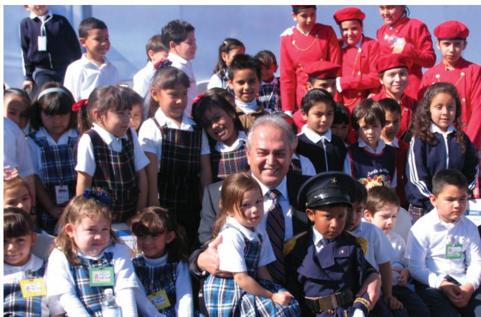
Consolidación de la reforma curricular.

De una bolsa de 300 millones de pesos destinados a “Beca Progreso”, se han ejercido 252 millones 398 mil pesos que han beneficiado a dos mil 918 escuelas y centros de trabajo, así como a más de 614 mil alumnos de educación básica.