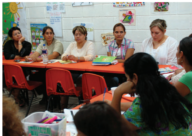
Capacitación sobre reforma curricular en educación básica.

Estas dependencias se sumaron a instancias del SEE como: CENDI, Educación Indígena, Educación Especial, Educación Migrante, Educación inicial No Escolarizada, UPN (unidades Mexicali y Tijuana) y estancias particulares, para mejorar la calidad del servicio.