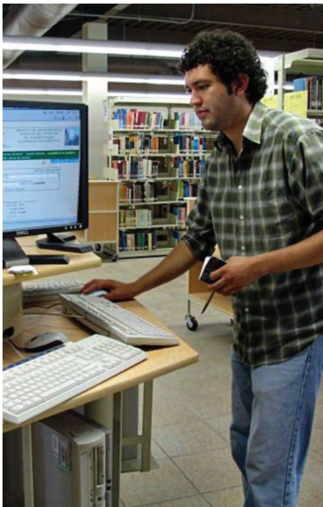
Biblioteca Central, UABC campus Tijuana.

En este rubro, se logró acreditar cuatro programas, con lo que se benefició a 40 mil 135 alumnos del nivel.