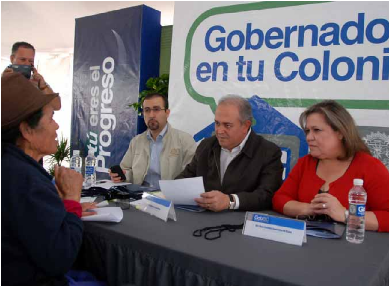
Participación ciudadana en evento “Gobernador en Tu Colonia”, Mexicali.

El programa de trabajo “Gobernador en Tu Colonia” ofrece el espacio donde el ciudadano puede entregar de manera directa sus solicitudes o plantear la problemática de la comunidad y permite llevar a las comunidades con el fin de atender en forma directa a los ciudadanos con la presencia del Ejecutivo y de su Gabinete.