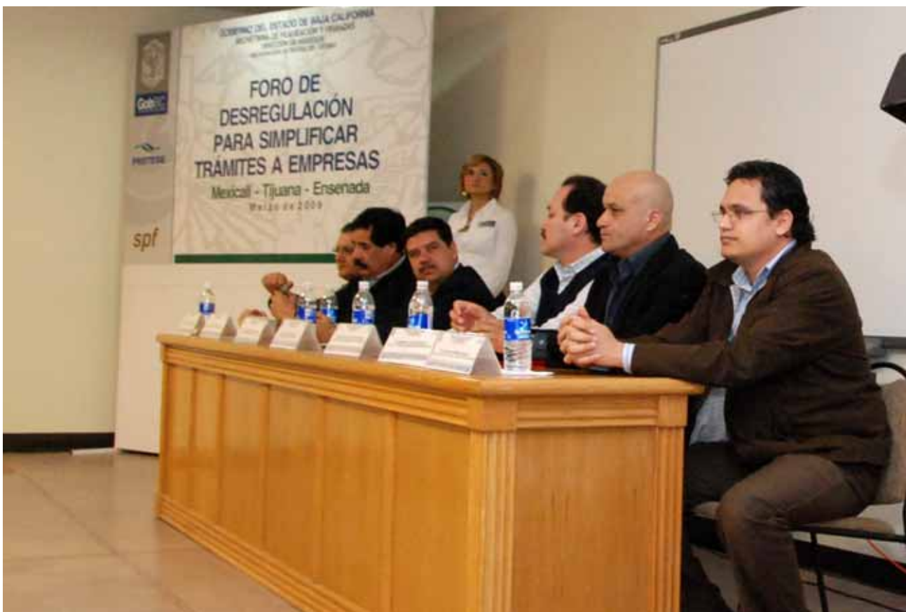
Foro de Desregulación para Simplificar Trámites a Empresas en Mexicali, Tijuana y Ensenada.

pláticas a las que acudieron alrededor de 300 personas entre estudiantes, profesionistas y empresarios.