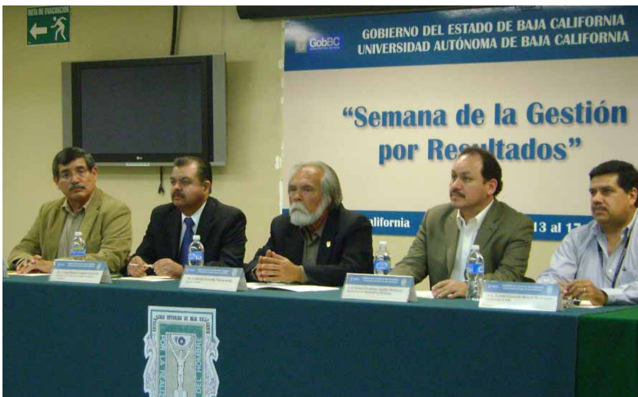
Semana de la Gestión por Resultados UABC, Mexicali.

Se han realizado ampliaciones presupuestales por la cantidad de 1 mil 97 millones 674 mil pesos, con la reasignación de recursos radicados en 2008 de fondos federales vigentes en 2009.