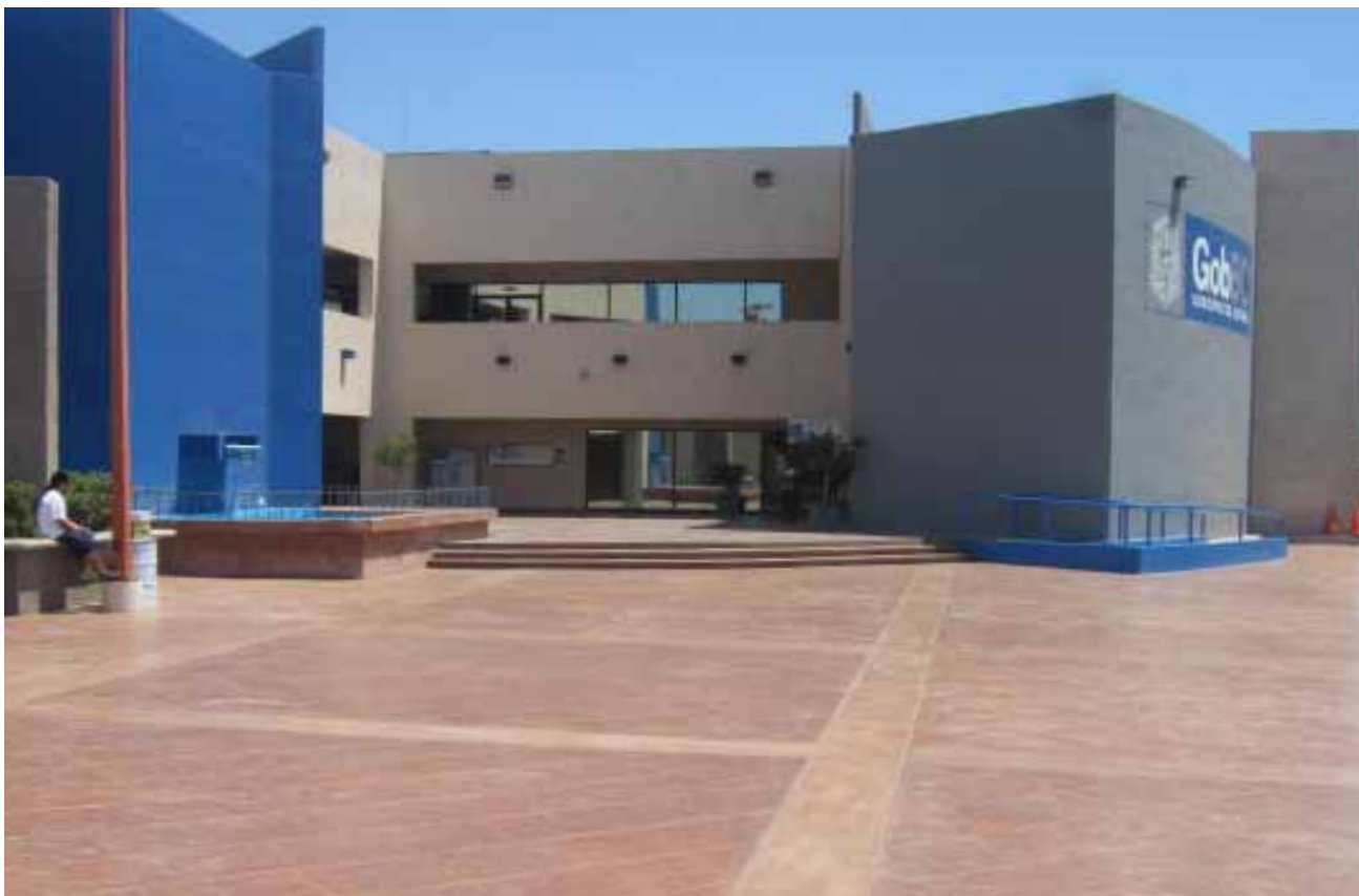
Explanada del Centro de Gobierno, Playas de Rosarito.

Como resultado de lo anterior, los usuarios que consulten el Sistema de Información Registral vía electrónica, tendrán acceso a las imágenes de los documentos inscritos en el Registro Público, sin tener que recurrir a la consulta física