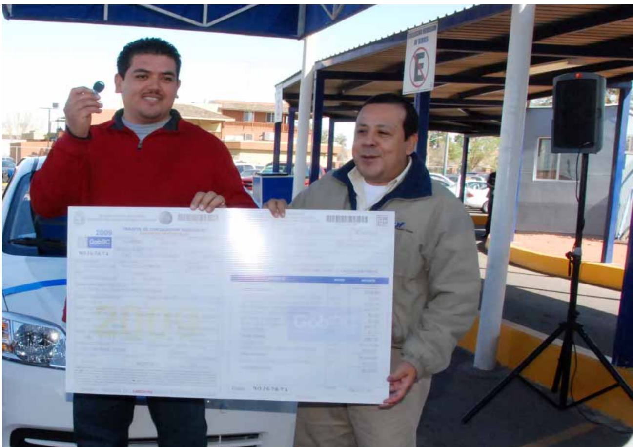
Entrega de premio Sorteo “Revalida y Gana”, Mexicali.

Durante el primer trimestre de 2009 se beneficiaron con la medida de reducción en el costo de los derechos de control vehicular 361 mil 678 ciudadanos, con descuentos de 12, 8.5 y 5 por ciento. Una vez más el Gobierno del Estado ha reconocido a los contribuyentes que cumplieron en tiempo y forma con sus obligaciones fiscales, ya sea a través de descuentos por pronto pago o mediante premios vía sorteos.