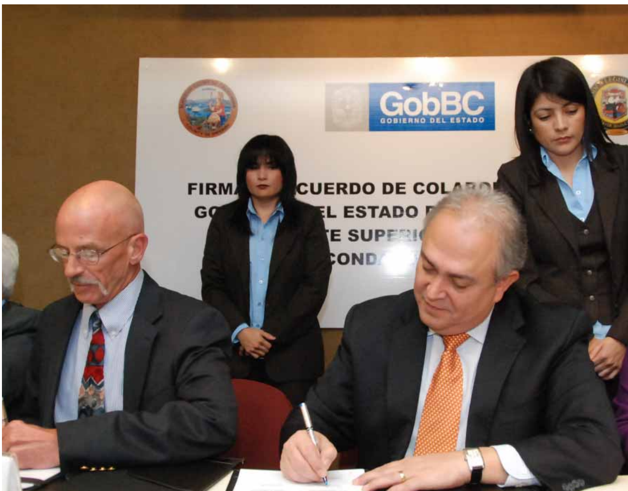
Acuerdo de colaboración entre el Gobierno del Estado y la Corte Superior del Condado de Imperial, Mexicali.

Con el objeto de sensibilizar a los defensores de oficio en la importancia del Sistema Acusatorio Adversarial, durante el presente período se les capacitó en diversas materias que tienen íntima conexión con el nuevo sistema, como: Derecho Constitucional, Derecho Internacional, Argumentación Jurídica, Ética Profesional, Derecho Penal Sustantivo, Técnicas de Litigación Oral, Técnicas de Interrogatorio y Contrainterrogatorio; contando con la participación de expositores de organizaciones como PRODERECHO, Instituto Tecnológico de Monterrey, Instituto de Formación Profesional de la Procuraduría de Justicia del Distrito Federal, Universidad Autónoma de Baja California, Comisión Nacional de los Derechos Humanos, Supremo Tribunal del Estado de Chihuahua, así como de la Defensoría Pública del mismo estado, entre otros.