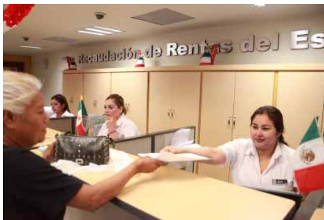
Atención ciudadana en oficinas de Recaudación de Rentas, Mexicali.

El pronóstico de ingresos para el ejercicio 2009 se estima una recaudación por fuentes estatales de 5 mil 2 millones de pesos, que representan el 17.76 por ciento del total de la recaudación en el Estado. Es de señalar que Baja California se ha caracterizado por ser generadora de recursos propios, muy por encima de la media nacional.