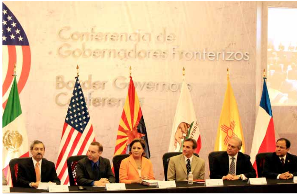
Conferencia de Gobernadores Fronterizos en Monterrey, Nuevo León.