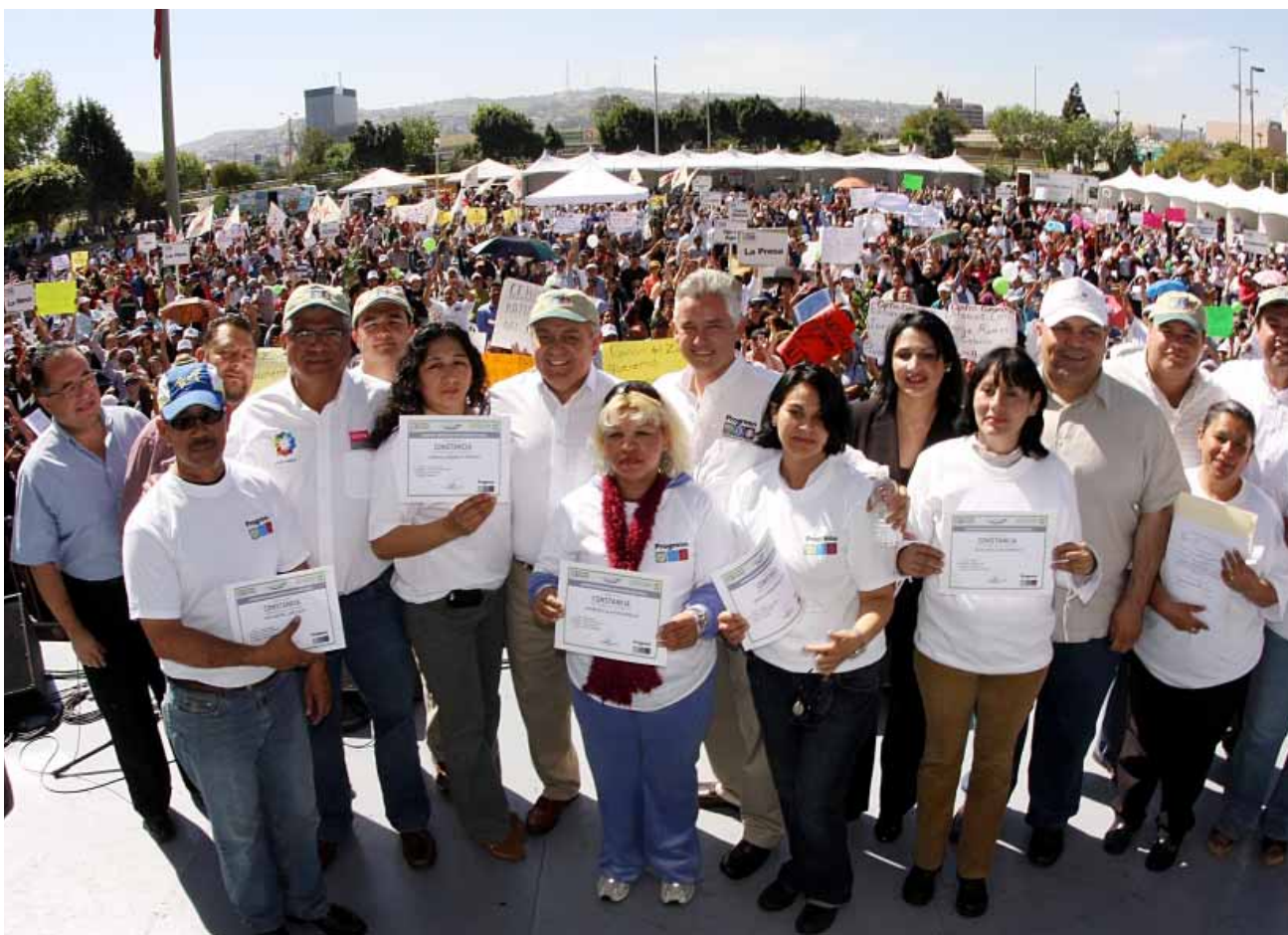
Coordinación entre el Poder Ejecutivo y los municipios del Estado, Tijuana.

A partir del 2008, el Estado atendió el fortalecimiento municipal, por lo que se incorporó al “Programa de Ciudades Hermanas”, que promueve la Secretaría de Relaciones Exteriores (SRE), a través de la Dirección de Gobiernos Locales, con la finalidad de servir como enlace y apoyo a los municipios.