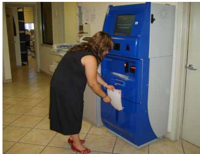
Módulo de atención expedidor de copias certificadas, Mexicali.

En continuidad con el proyecto de “Captura por Demanda”, se han logrado digitalizar más de 31 mil 957 actas, alimentando la base de datos de actos registrales, con más de 247 mil 950 imágenes digitalizadas.