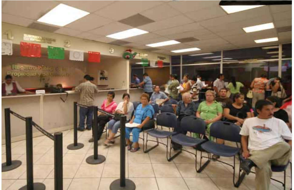
Oficinas del Registro Público de la Propiedad y del Comercio, Mexicali.