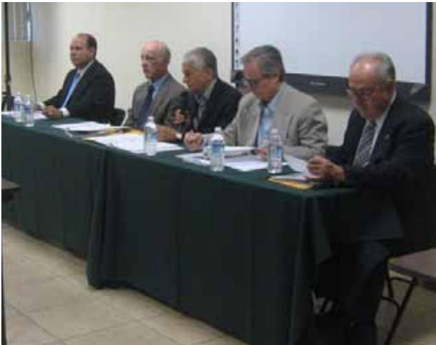
Examen por oposición de aspirantes a la Función Notarial, Mexicali.

Para promover el desarrollo humano sustentable y la competitividad de la economía, se facilita a las partes interesadas en un instrumento notarial, y a la población en general, la consulta de los protocolos de las Notarías en Baja California, con antigüedad de más de 10 años, de los cuales se actualizan año con año en cumplimiento a la Ley del Notariado para el Estado de Baja California, por lo que actualmente se encuentran en el Archivo General de Notarías del Estado, 44 mil 28 libros, contados de 1878 al año 1999.