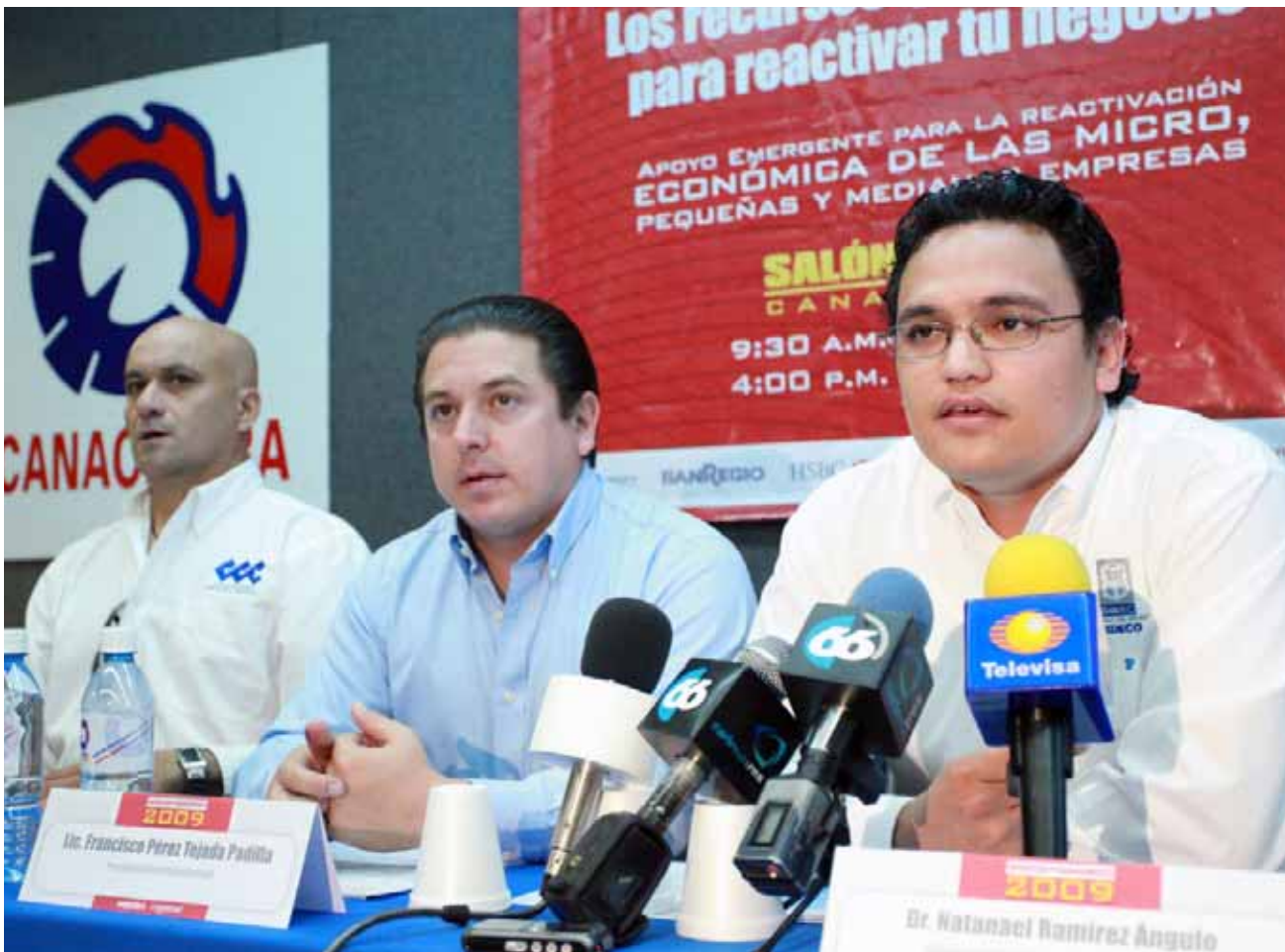
Programa de Apoyo para la Generación de Empleos en Baja California.

canje extemporáneo de placas, calcomanías, tarjetas de circulación del servicio particular y licencias de conducir.