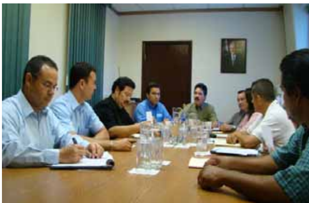
Reuniones de trabajo con diversos grupos sociales, Mexicali.

comité de coordinación interinstitucional entre los tres órdenes de gobierno y producto de ésta se integraron cuatro mesas de trabajo en las áreas de epidemiología, de atención médica, de apoyo de programas sociales y de infraestructura y saneamiento con el propósito de establecer acciones de atención inmediata a la contingencia.