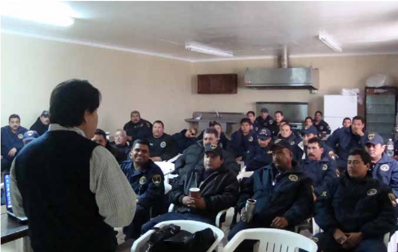
Capacitación a Agentes de Seguridad y Custodia Penitenciaria, Tijuana.

En el caso de los agentes de la Policía Estatal Preventiva y Policías Ministeriales, se promovió la igualdad entre las un mil 475 plazas de estas dos corporaciones policíacas, homologando sus percepciones mensuales a un monto base de 17 mil pesos mensuales.