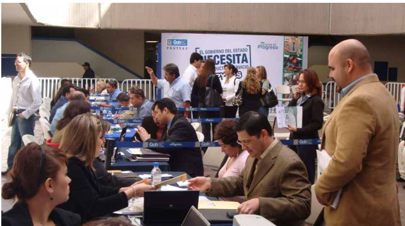
Feria de MIPyMES para adquirir servicios y productos para Gobierno del Estado, Mexicali.