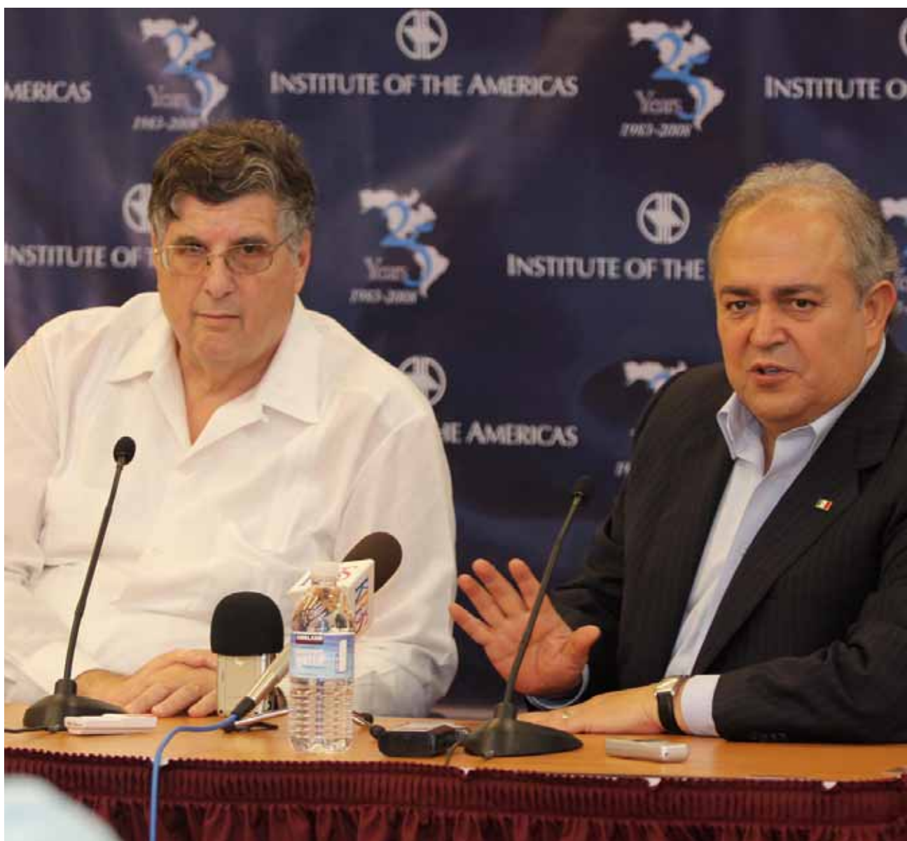
Participación del Gobierno de Baja California en el evento Tequila Talk en San Diego, California.

Se logró contactar a la “Foundation Athletes for Education of San Diego”, misma que realizó una donación a la Fundación Alumbra, dedicada a apoyar a niños con autismo.