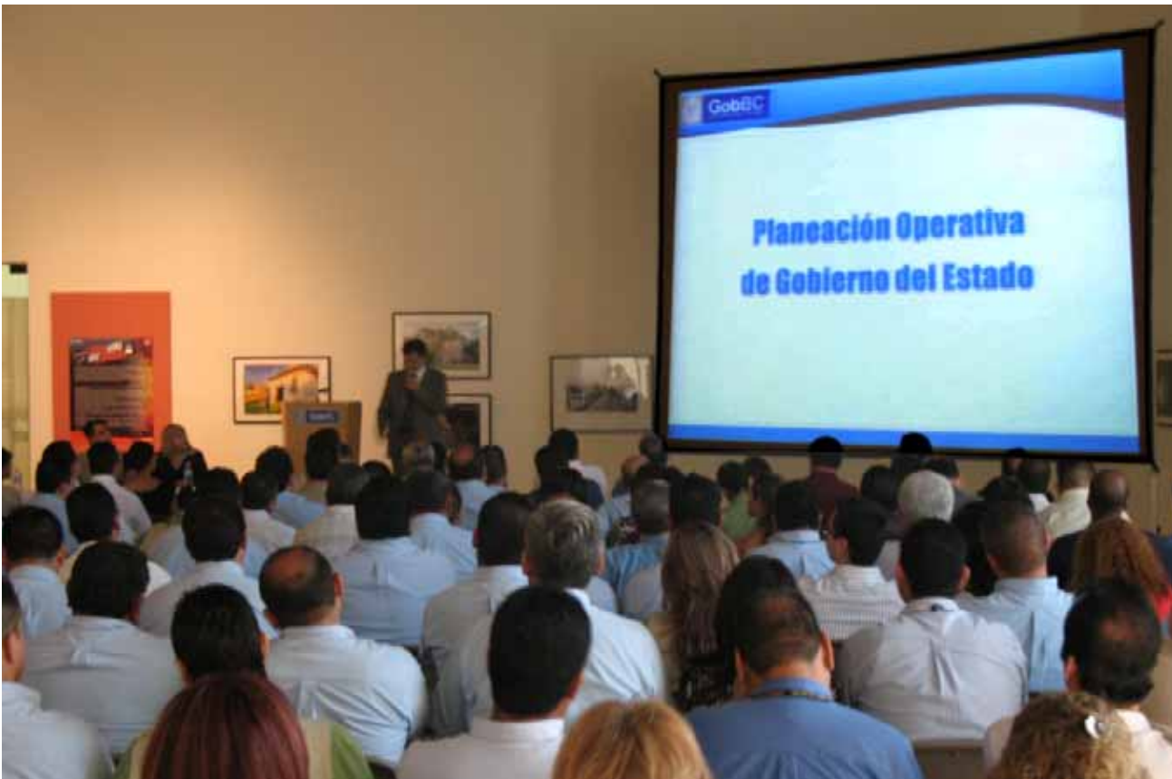
Sesión de Planeación Operativa, Mexicali.

a los empresarios 3 mil pesos por cada trabajador adicional que contraten; logrando la participación de 46 empresas adheridas al programa. Con ello se han generado 305 nuevos empleos con una derrama de recursos de 915 mil pesos.