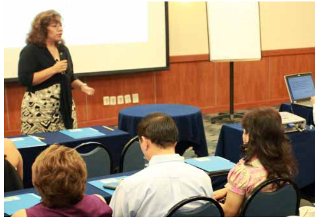
Capacitación al personal de áreas de atención al público, Mexicali.

e Intercambio de Información Registral con el Ayuntamiento de Mexicali, se implementó un sistema de creación de fraccionamientos y condominios, en el cual se integran todos los actores gubernamentales que participan en esta cadena productiva. Ello beneficiará a la industria inmobiliaria.