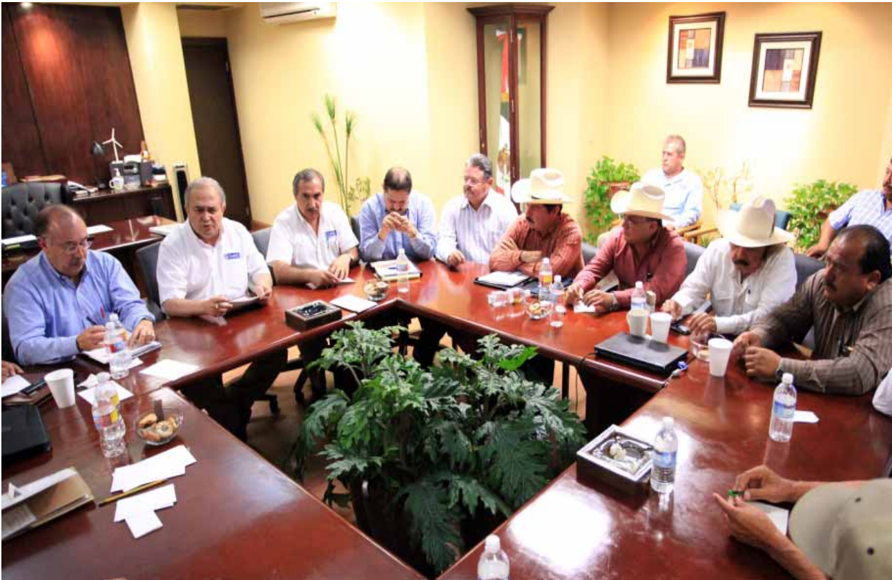
Reunión con productores agrícolas de trigo, Mexicali.

Adicional a esto, se acordó otorgar 300 pesos por hectárea para realización de un disqueo para la incorporación de residuos de cosecha, lo que representa 50 pesos por tonelada de trigo, que además de un bono de 300 pesos para la adquisición del fertilizante Urea representando 50 pesos más por tonelada de trigo; y que por parte del Gobierno Federal (SAGARPA y ASERCA) se otorgará un bono de 300 pesos por hectárea para el fertilizante fósforo, conformándose un ingreso para el productor de 3 mil 200 por tonelada de trigo, 3 mil 50 precio de trigo más 150 de apoyos complementarios.