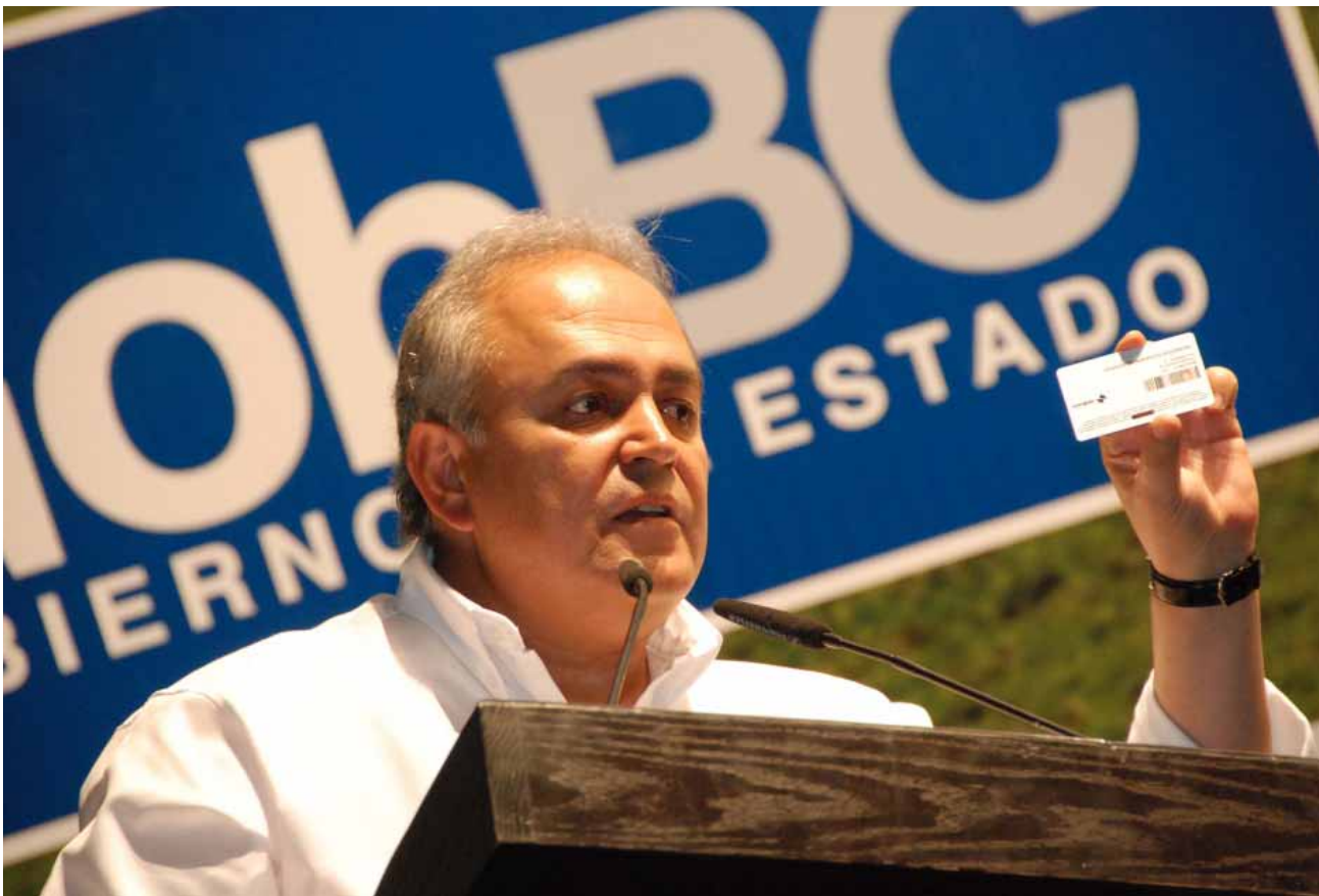
Entrega de tarjetas para el pago de energía eléctrica, Mexicali.

de credencialización que permite identificar los beneficiarios del subsidio que otorga el Gobierno del Estado para el mismo.