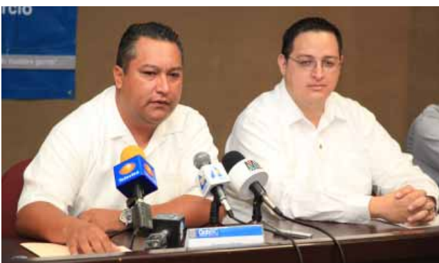
Presentación de la Campaña “Testamento Ológrafo”, Mexicali.

los trámites a través de un servicio de calidad, habiéndose reducido al máximo los tiempos para su realización, certificando en Mexicali dos mil 853 documentos; en Tijuana tres mil 224; en Ensenada un mil 262; en Tecate 342; y en Playas de Rosarito 452, los cuales posibilitarán al ciudadano a realizar los trámites que necesiten dentro y fuera del País.