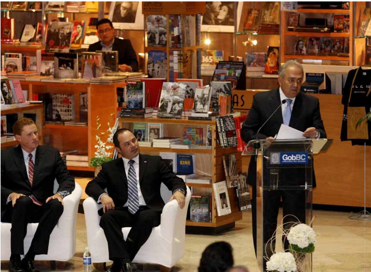
Presentación del Libro de Oro de Baja California, Tijuana.

información que se actualiza diariamente en el portal de Internet.