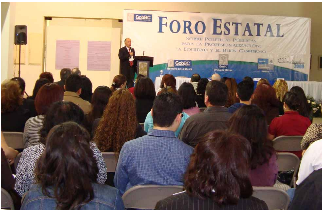
Foro Estatal sobre Políticas Públicas para la Profesionalización, la Equidad y en Buen Gobierno, Mexicali.

Además el pasado mes de agosto, Baja California fue sede de la tercera edición del Foro de Intercambio de Desarrollo Administrativo y Tecnológico (FIDAT), espacio para compartir las experiencias exitosas de los estados en temas de evaluación y certificación de competencias laborales del personal.