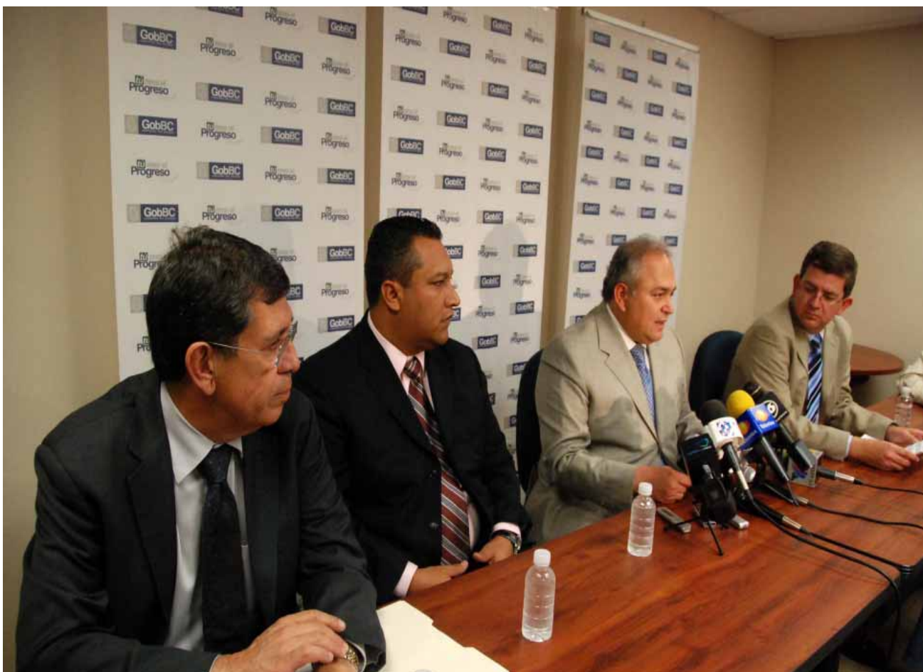
Rueda de prensa con el Gobernador y funcionarios del Estado, Mexicali.

así como la relación diaria con representantes de medios de comunicación locales, nacionales e internacionales.