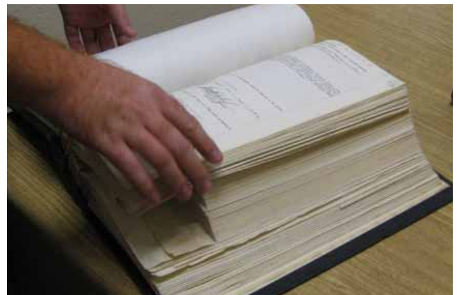
“Programa de Revisión y Actualización de la Función Notarial”, Mexicali.

Este último reglamento, con su aplicación, logrará el establecimiento de las bases en las que se desarrollarán y aplicarán los exámenes a los aspirantes al ejercicio de la función notarial y de notarios titulares, a efecto de asegurar el ingreso al notariado en Baja California de profesionales del derecho altamente calificados con gran compromiso social, en promoción de la transparencia y rendición de cuentas, garantizando el pleno ejercicio de los derechos de la ciudadanía en la protocolización de sus actos jurídicos o constancias de hechos jurídicos, beneficiando con su aprobación a un millón 720 mil bajacalifornianos.