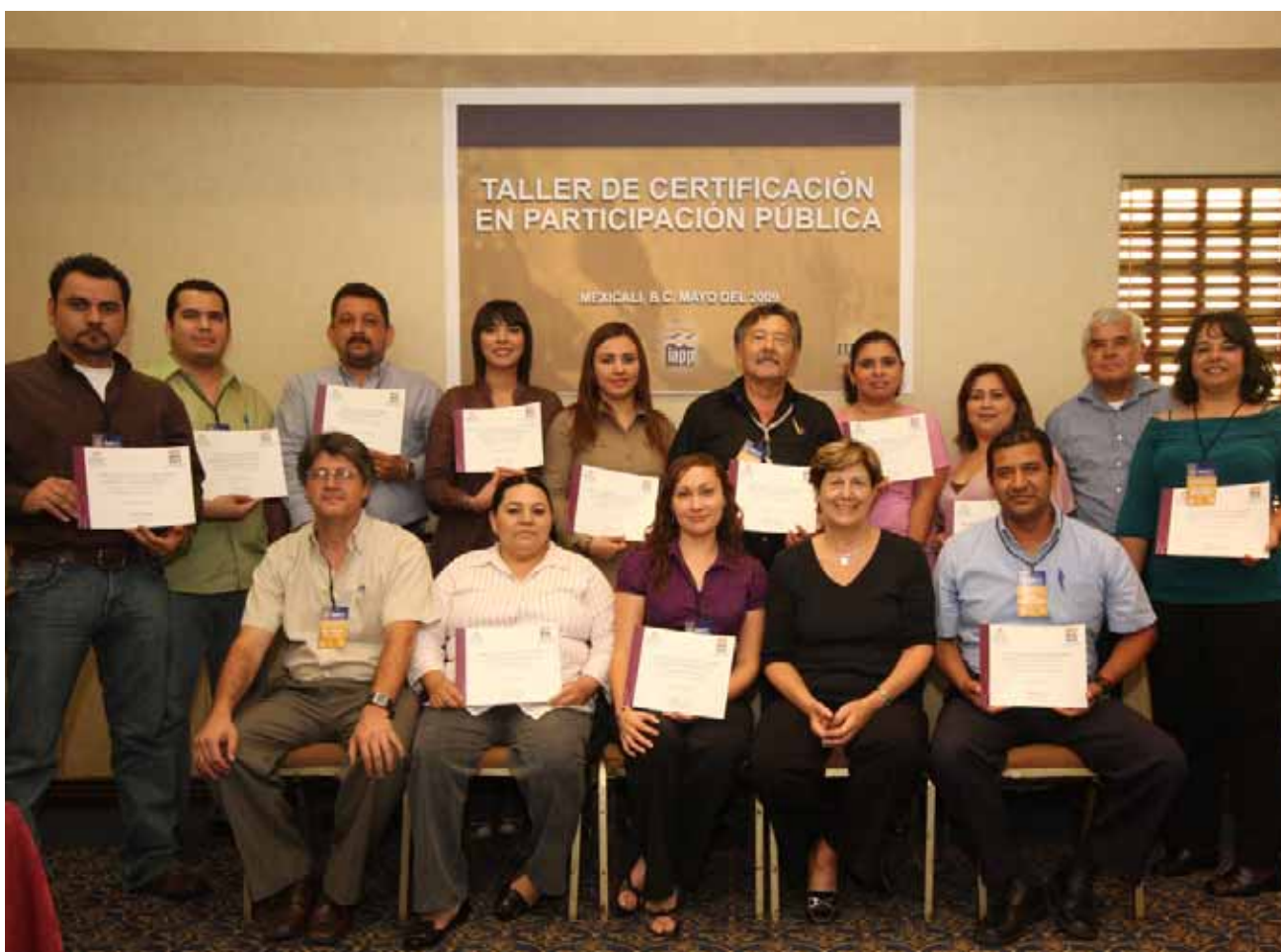
Taller para la Certificación en Participación Pública, Mexicali.

Se creó el Sistema de Investigación, Innovación y Desarrollo Tecnológico de Baja California (SIDEBAJA), como órgano técnico de consulta, investigación, innovación y desarrollo tecnológico, que agrupa a instituciones de educación superior, centros de investigación, clusters empresariales y empresas, que contribuyen ordenadamente y de manera articulada con la finalidad de ampliar y potenciar las capacidades del Estado.