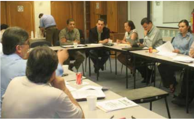
Reunión COPLADE-COPLADEM'S, Mexicali.