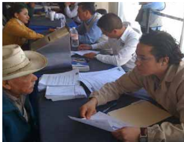
Atención especializada a usuarios en jornadas registrales, Tijuana.

En materia de certificación de documentos y atendiendo al compromiso permanente que se tiene con la comunidad, se llevaron a cabo