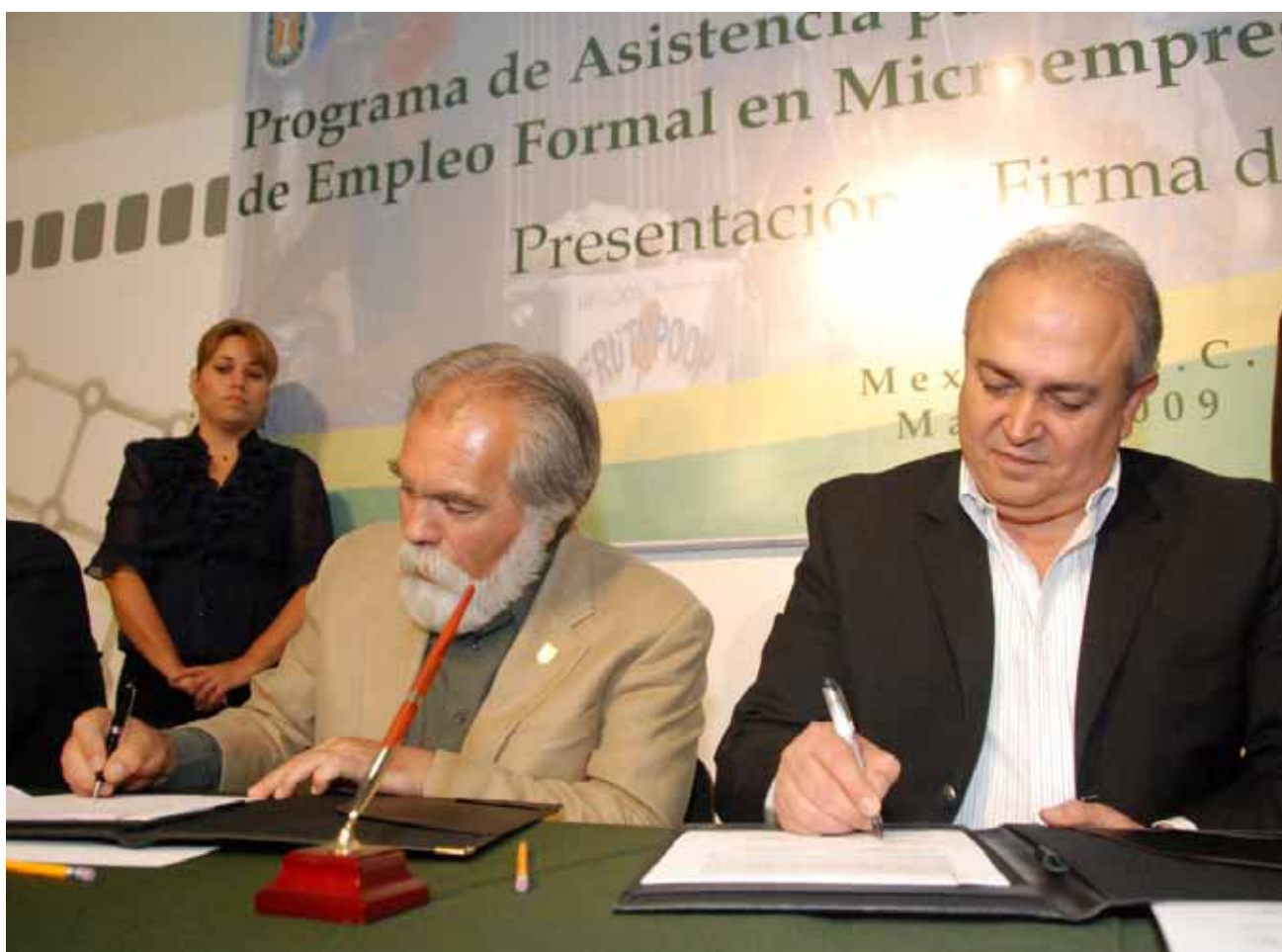
Firma de convenio entre la UABC y el Gobierno del Estado para la generación del empleo formal, Mexicali.

Como apoyo a la economía familiar, se publicó el decreto mediante el cual se condonan a las personas físicas y morales los adeudos por recargos y multas generados por la falta de cumplimiento oportuno de las contribuciones estatales relacionadas con los derechos por el