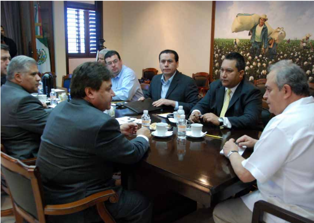
Convenio de Coordinación en el Marco del Sistema Nacional de Seguridad Pública, Mexicali.

destinando el ejecutivo Federal y Estatal recursos por más de 350 millones de pesos, en favor de la seguridad de los bajacalifornianos.