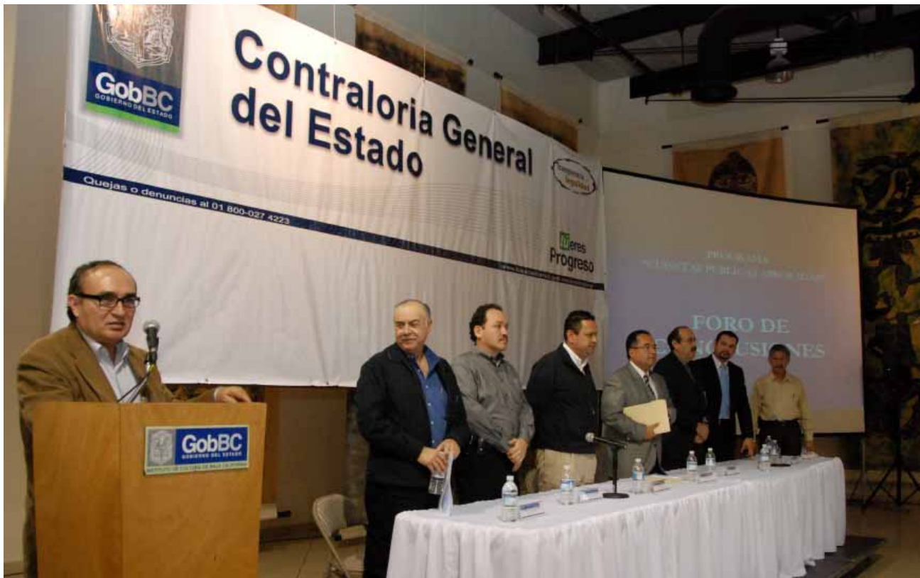
Foro de Conclusiones del "Programa Cuentas Públicas Aprobadas", Mexicali.

Por sexto año consecutivo, el Gobierno del Estado dictaminó su información financiera por medio de una firma internacional de contadores públicos y por el Órgano Superior de Fiscalización del Estado de Baja California, resultando de esta revisión que la información financiera cumple con los criterios de razonabilidad y confiabilidad.