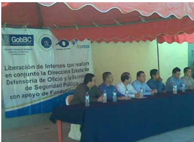
Evento de liberación de internos con apoyos de la Fundación TELMEX, Baja California.

Como resultado, se obtuvieron 224 jornadas de asesoría jurídica por medio de mesas de