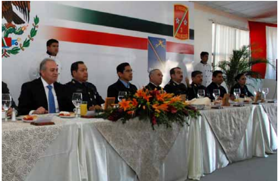
Participación del Gobernador del Estado en evento "Día del Ejército", Mexicali.