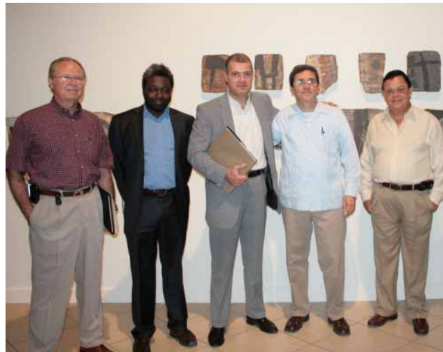
Visita del agregado de cultura de la embajada de Francia a Baja California.

Se apoyó la realización de las reuniones de Alcaldes Fronterizos México-Estados Unidos y Alcaldes Fronterizos de las Californias, con