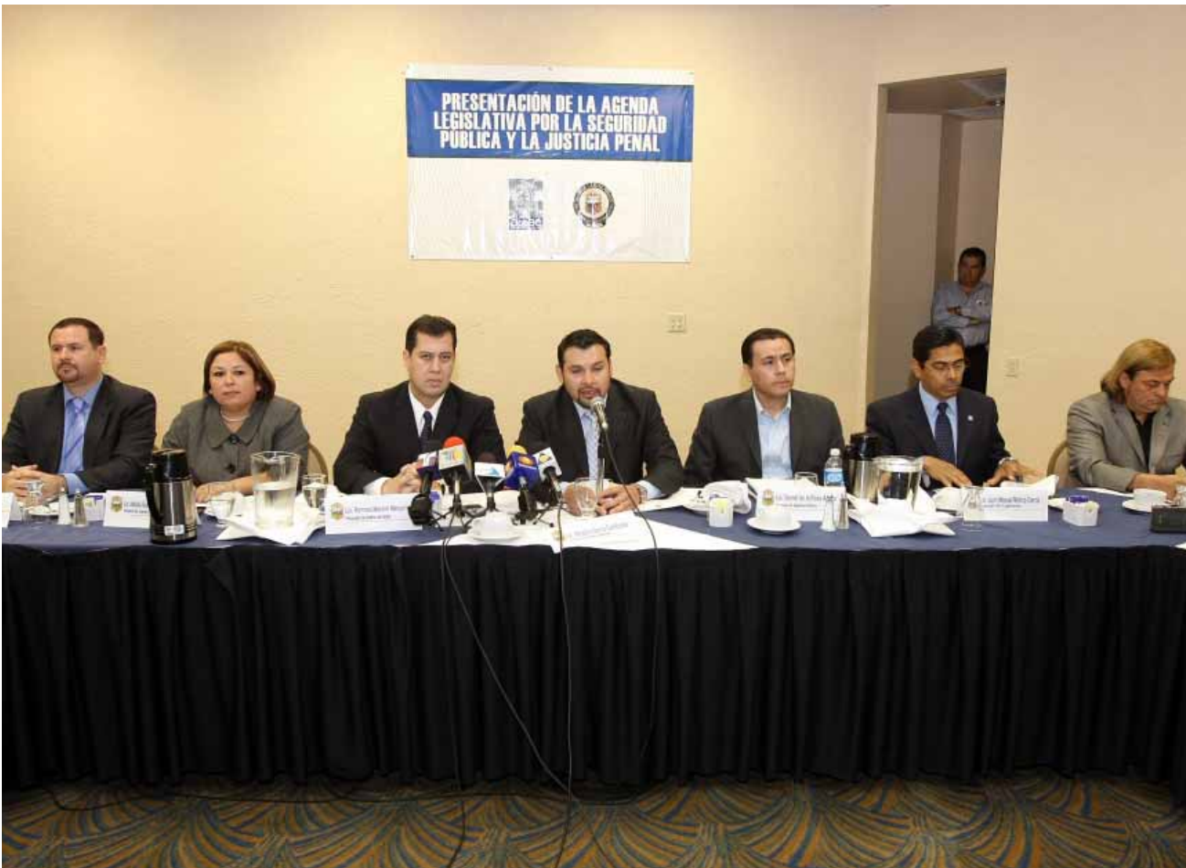
Presentación de la Agenda Legislativa por la Seguridad Pública y la Justicia Penal, Mexicali.

atención de personas que tengan necesidades especiales causadas por algún trastorno del desarrollo, como el autismo, de manera que el Sistema Desarrollo Integral de la Familia promueva y opere centros y servicios para la atención de personas que padezcan alguno de estos trastornos.