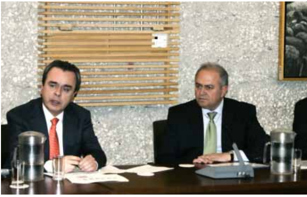
Reunión del Gobierno del Estado con autoridades del INFONAVIT, Mexicali.

gobierno en el Estado y las personas de derecho público de carácter estatal con autonomía constitucional.