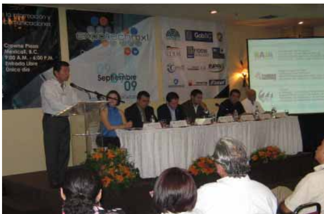
Expo Tech 2009, Mexicali.

Se participó en el Taller de Team Software Process y Personal Software Process, impartido por miembros del Cluster de Tecnologías de Información de Baja California, A.C.