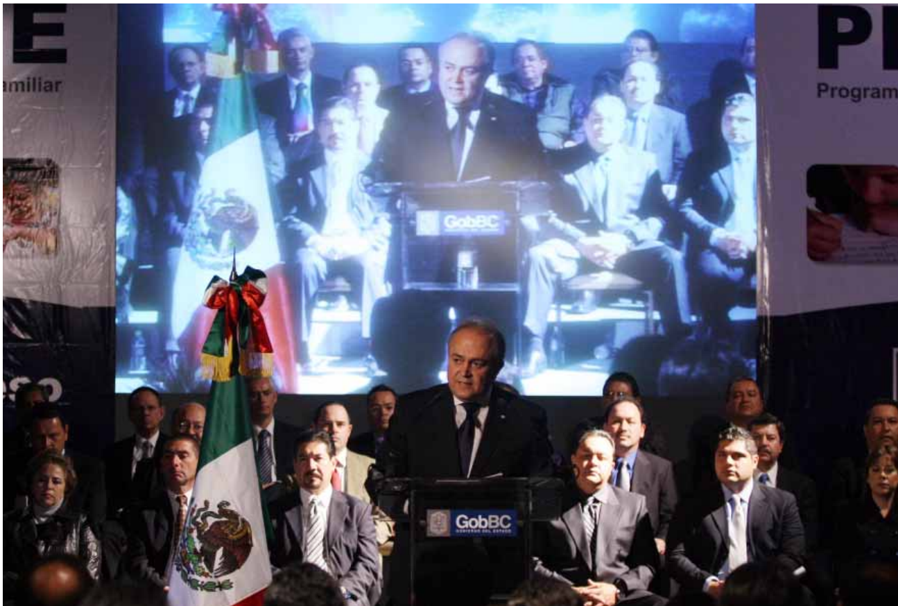
Presentación del Programa PROTEGE, Tijuana.

También a la Secretaría de Educación y Bienestar Social se le asignó un predio en el Fraccionamiento Rancho San Ramón, Delegación Vicente Guerrero, en el Municipio de Ensenada con una superficie de 60 mil 650 metros cuadrados, el cual se encuentra destinado para la construcción de un “Complejo de Equipamiento Regional Educativo, Deportivo y Cultural”, así mismo se asignaron 19 inmuebles para la construcción de nuevas escuelas de los distintos niveles básicos en lo que va de este año y se regularizó la asignación de 21 planteles escolares.