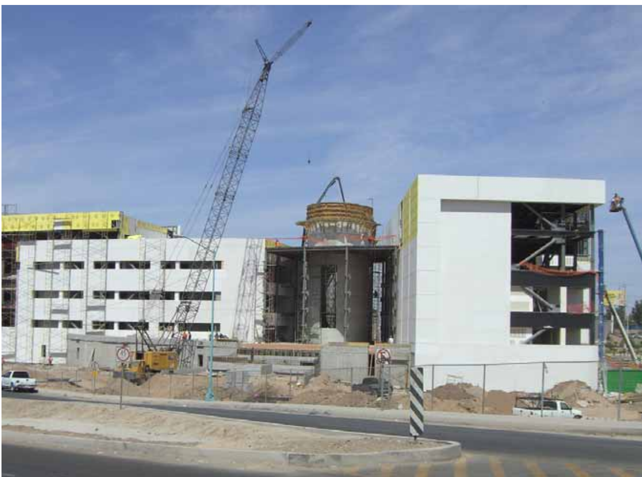
Construcción del Nuevo Centro de Justicia Penal, Mexicali.

cuadrados con la finalidad de que se construya una nueva Agencia del Ministerio Público de González Ortega.