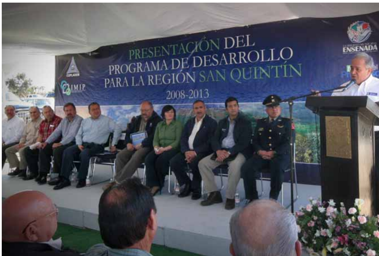
Presentación del Programa de Desarrollo para la Región San Quintín, San Quintín.