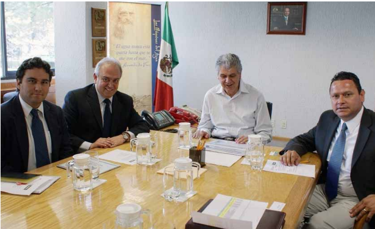
Convenio suscrito entre el Gobierno del Estado y la Comisión Federal de Electricidad, Mexicali.

gestión de firma y asesoría derivada de convenios, contratos, decretos, acuerdos y consultas jurídicas provenientes de las distintas dependencias y entidades estatales, federales, municipales y de particulares.