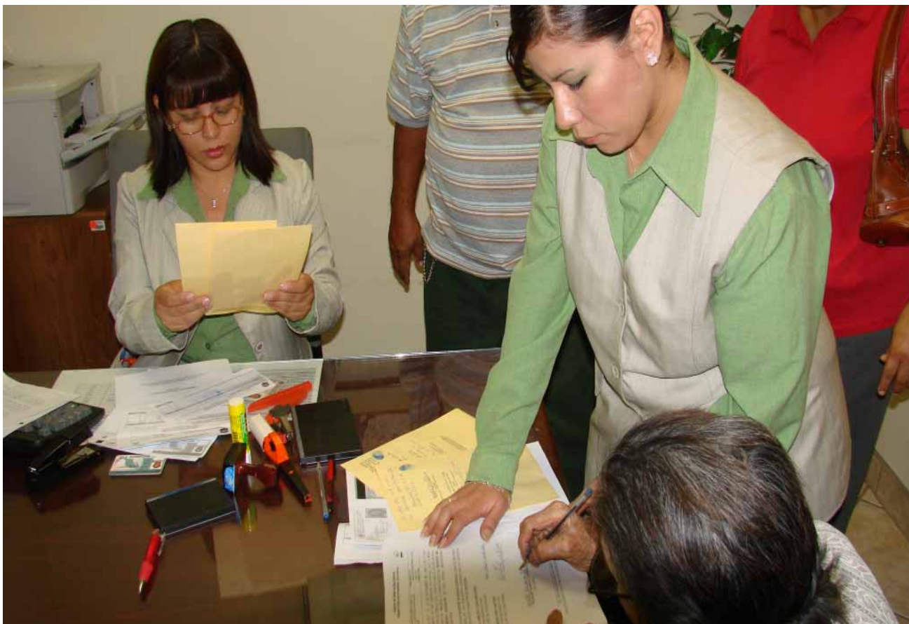
Solicitud de ratificación de firmas al RPPC, Mexicali.

En el mismo tenor y con el fin de promover acciones a favor de un medio ambiente sano, se presentó la iniciativa de reforma a diversos artículos de la Ley de Adquisiciones, Arrendamientos y Servicios para el Estado de Baja California para incluir la variable de sustentabilidad ambiental en las adquisiciones que realicen los tres poderes de