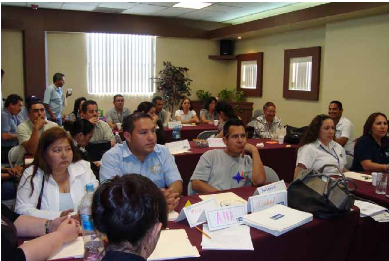
Capacitación en materia de Sentido de Pertenencia a la Función Pública, Tijuana.

Además, para evitar y minimizar accidentes o riesgos de trabajo, se vigila que se dé cumplimiento a la normatividad en materia de seguridad e higiene a través de las comisiones