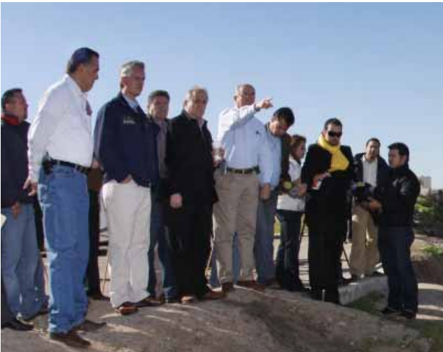
Atención a la ciudadanía para regularización de la tenencia de la tierra, Tijuana.

La Secretaría General de Gobierno (SGG) en coordinación con diversas dependencias del Ejecutivo Estatal, coadyuva en el análisis jurídico y político para la disposición de las reservas de suelo necesarias que permitan el desarrollo de proyectos estratégicos para el Estado como son: la construcción de la Garita Otay II y el Centro Metropolitano de Convenciones de Tijuana; asimismo se continúan las gestiones para la regularización de importantes asentamientos como son en Mexicali, la colonia Tavizon Silva; en Tijuana, Ejido Rojo Gómez, Tres de Octubre, Granjas Buenos Aires, Cañones de la Raza y Ejido Francisco Villa; en Playas de Rosarito, el Morro, Poblados Morelos y Venustiano Carranza, y en el Municipio de Ensenada, Camalú, Cañón Buenavista y Arroyo Aguajito, entre otros.