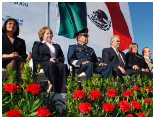
Conmemoración del “Día de la Bandera”, Mexicali.

Se realizaron 120 revisiones de patrimonios a servidores públicos, por lo que se espera que la información proporcionada por éstos en sus declaraciones de situación patrimonial concuerde con lo que efectivamente poseen.