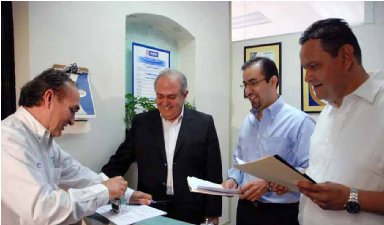
“Campaña de Entrega Oportuna de Declaración Patrimonial” en Gobierno del Estado, Mexicali.

Se llevaron a cabo dos mil 187 avalúos en toda la entidad, de los cuales 449 fueron exentos de pago, lo que generó un ahorro en servicios de valuación externa al Gobierno del Estado por un monto de 3 millones 181 mil pesos. Por otro lado, se generaron ingresos por 1 millón 623 mil pesos por concepto de elaboración de avalúos.