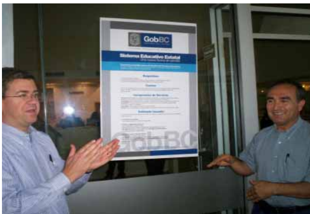
Carta Compromiso al Ciudadano en el Sistema Educativo Estatal, Mexicali.

Derivado de la ejecución del Convenio de Coordinación y Colaboración para la Difusión