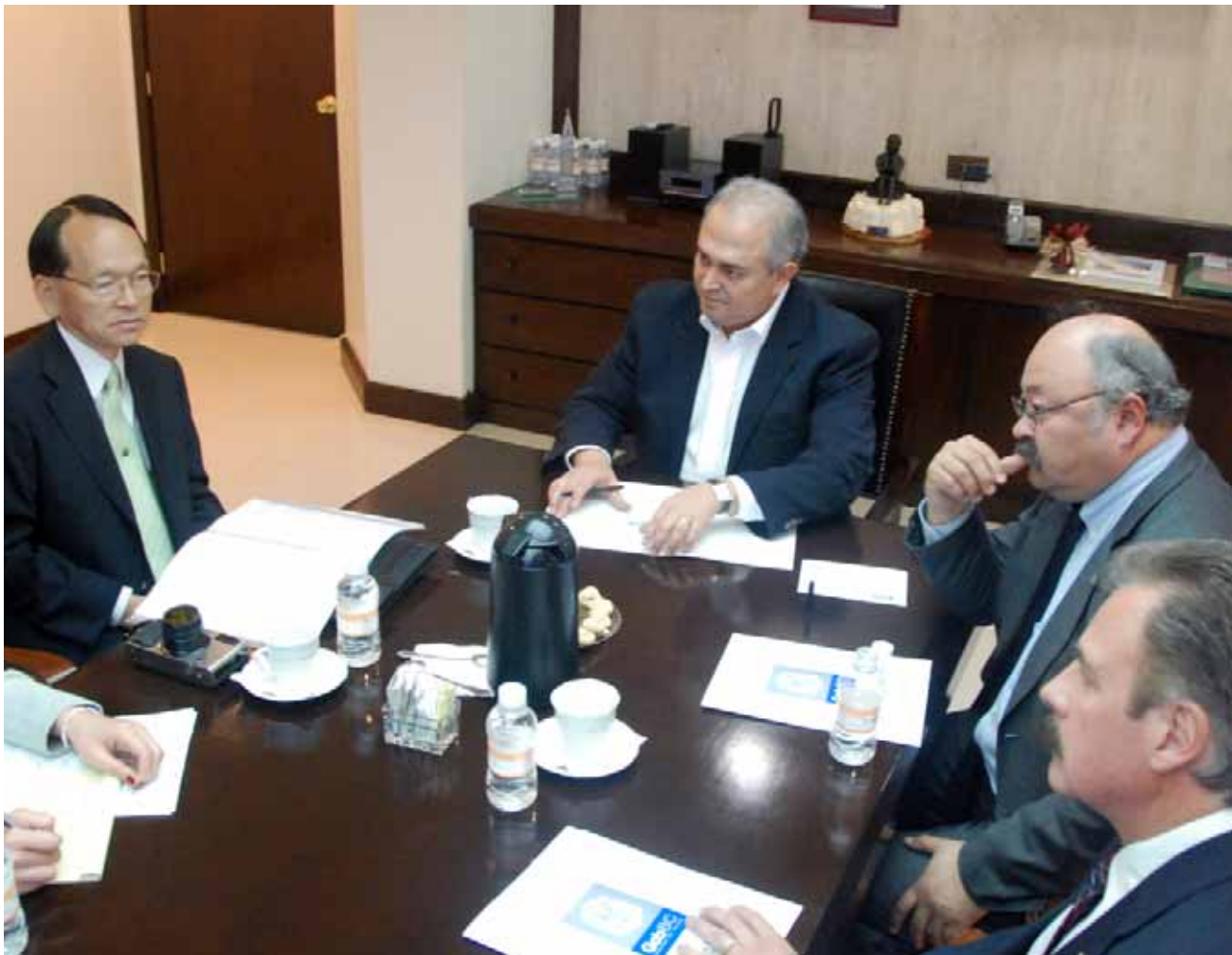
Reunión de trabajo con el embajador de Japón en México, Mexicali.

Se está trabajando en coordinación con instituciones académicas locales en la construcción de un plan indicativo para el desarrollo sustentable y competitivo de la región transfronteriza, que busca se deriven las líneas de proyección temática de las políticas públicas transfronterizas.