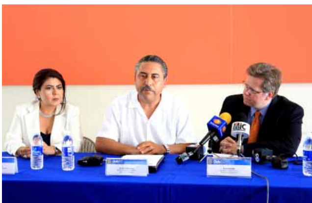
Conferencia “Diálogos por Baja California”, Mexicali.

la finalidad de establecer una sola agenda temática regional.