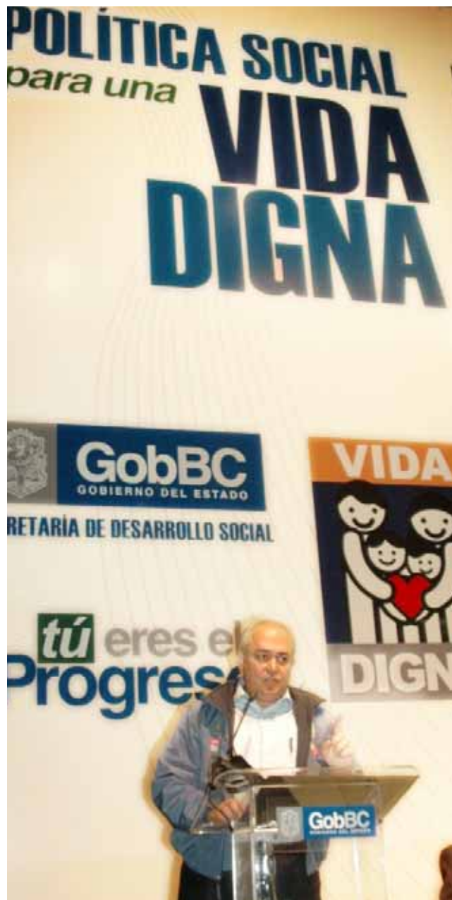
Presentación del Programa Vida Digna.

Atendiendo a las estrategias planteadas en el Plan Estatal de Desarrollo se trabajó en la mesa interinstitucional integrada por Oficialía Mayor, Secretaría de Planeación y Finanzas y la Contraloría General del Estado en la revisión y validación de 22 instrumentos normativos-administrativos de 13 dependencias y entidades. Lo anterior con el objeto de mantener actualizado el marco de actuación del Ejecutivo del Estado en términos de eficiencia, eficacia y modernización administrativa. En ese mismo sentido, se actualizaron 11 de las 35 normas administrativas en materia de administración