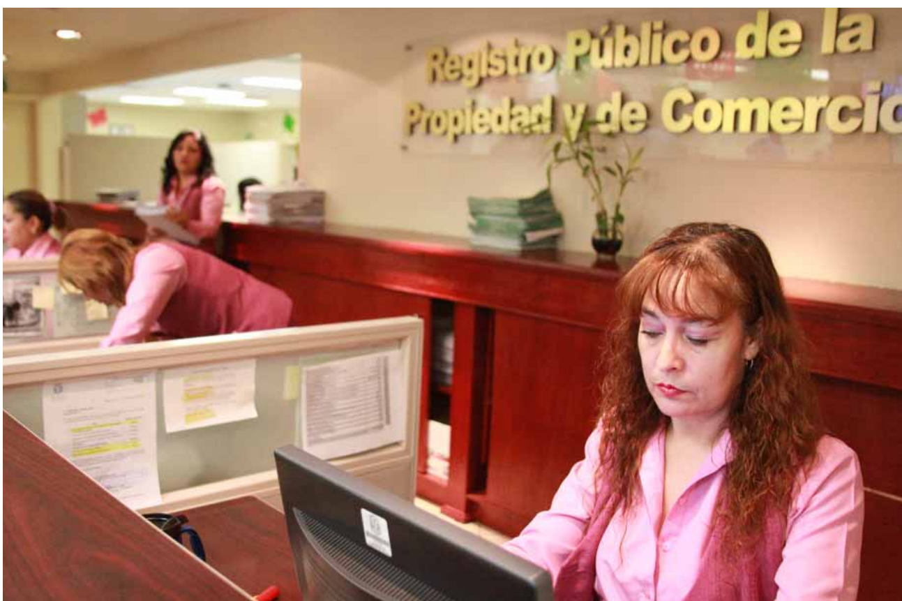
Atención ciudadana en las oficinas del Registro Público de la Propiedad y del Comercio, Mexicali.

ciudadanas, de ahí la importancia de impulsar el desempeño profesional de los servidores.