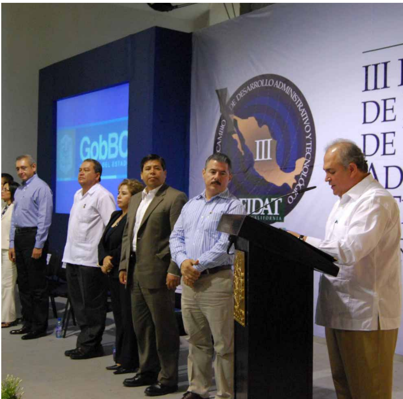
Foro de Intercambio de Desarrollo Administrativo y Tecnológico (FIDAT), Baja California.

Se contó con la participación de 19 entidades federativas representadas por 85 funcionarios públicos.