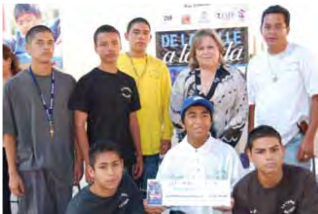
Beneficiados con el "Programa de la Calle a la Vida".

Con apoyo de esta Administración Estatal se fortaleció a 27 casas hogar con una aportación de 5 millones 272 mil pesos, que atendieron a un mil 436 menores que sufren de desintegración familiar y que no tienen un lugar donde vivir. Ahí, se les brindó un espacio para dormir, comer,