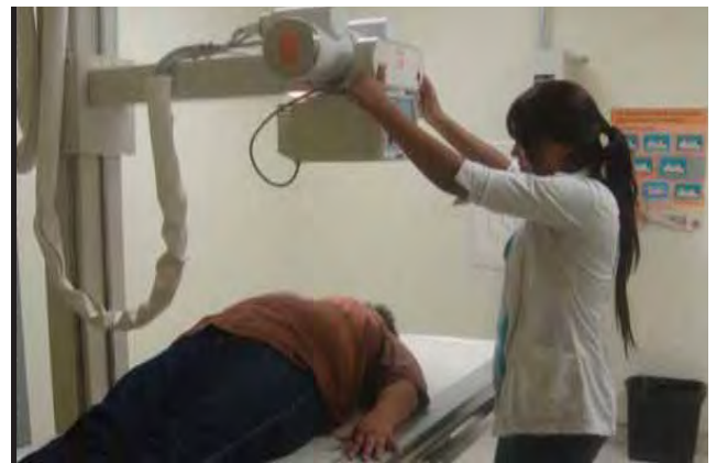
Equipo de imagenología del Hospital General de Tijuana.

Por ello, se trabaja en el proyecto de creación del Instituto Estatal de Capacitación e Investigación en Salud. Su contextualización y operación se analiza en el seno del Consejo Estatal de Salud para que éste sea la instancia