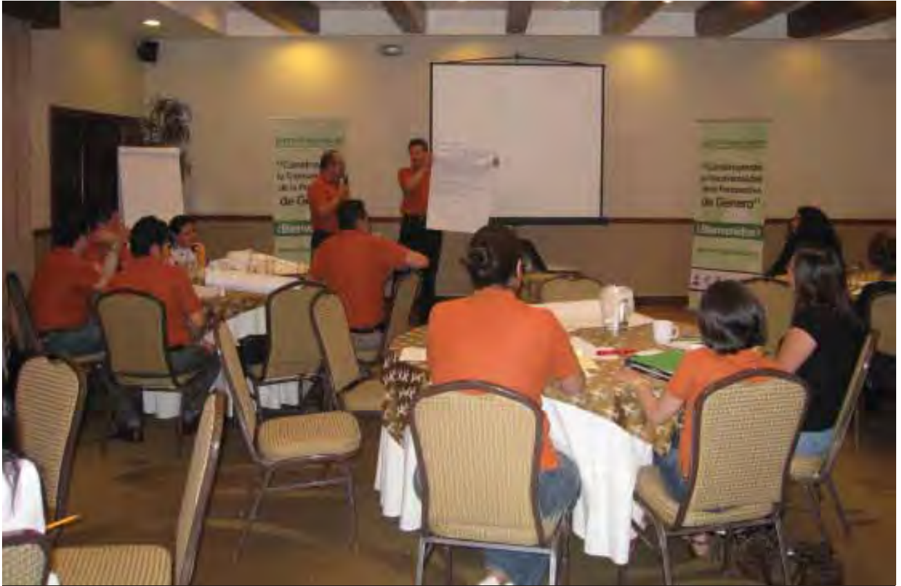
Taller de planeación y presupuestación con perspectiva de género, Mexicali.

como para psicólogos y verificadores del Instituto Estatal de Psiquiatría, y directivos de los centros de rehabilitación para usuarios del Estado. En total, esta capacitación abarcó a 248 personas.