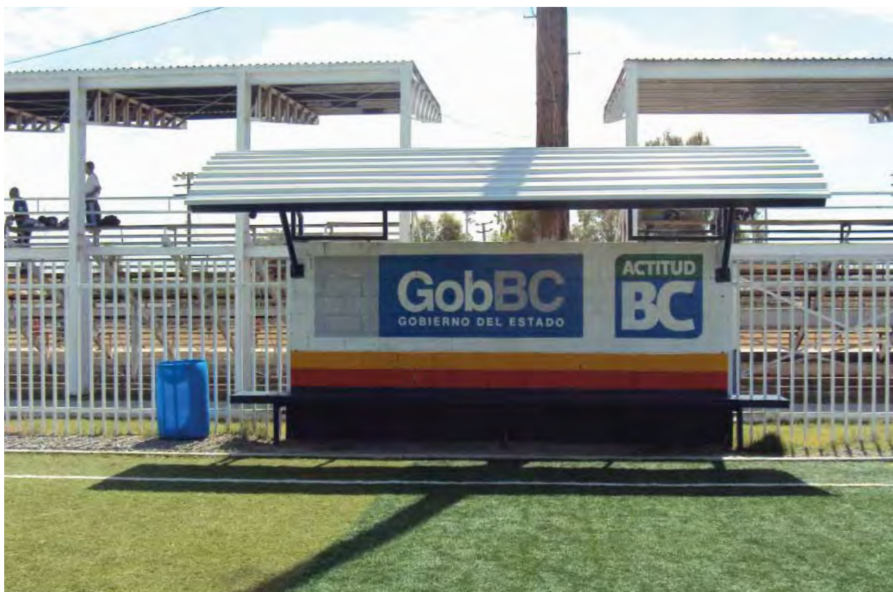
Instalación de pasto sintético en cancha del anexo Necaxa, Mexicali.

Dentro de las principales obras realizadas destacan en el Municipio de Tecate la construcción de la cancha de fútbol rápido en el ejido Felipe Ángeles y la construcción de gradas con techumbre, alumbrado y módulos sanitarios en la cancha de fútbol de la colonia Morelos II del Municipio de Ensenada, construcción de cancha de usos múltiples en el ejido Oaxaca del Municipio de Mexicali.