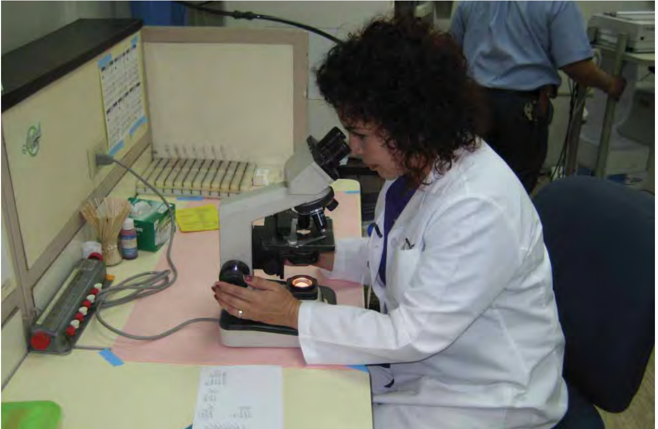
Detección de enfermedades infectocontagiosas, en el Laboratorio Estatal de Salud Pública.

pruebas voluntarias de detección de VIH, SIFILIS, TB, Hepatitis B y C, entrega de preservativos, prevenkits, intercambio de jeringas para evitar la diseminación del VIH y Hepatitis B y C, por uso de jeringas contaminadas, inmunizaciones, referencia a programas de rehabilitación; así como afiliación al Seguro Popular, facilitando el acceso a servicios de salud, a una atención digna y de esta manera mejorar la salud de la población reduciendo el impacto del VIH SIDA y otras ITS, en los próximos cinco años.