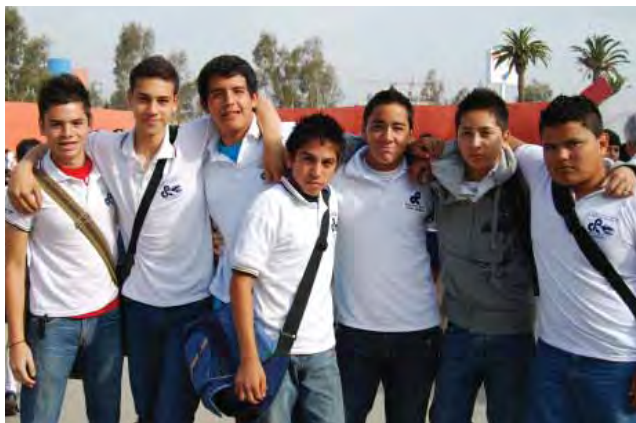
Asistentes a la conferencia, Amor y sexualidad.

en México y su participación política, Los jóvenes y la discriminación, La ley de voluntad anticipada o del bien morir, entre otros. En este evento participaron 40 jóvenes del Estado, pasando tres a la etapa nacional.