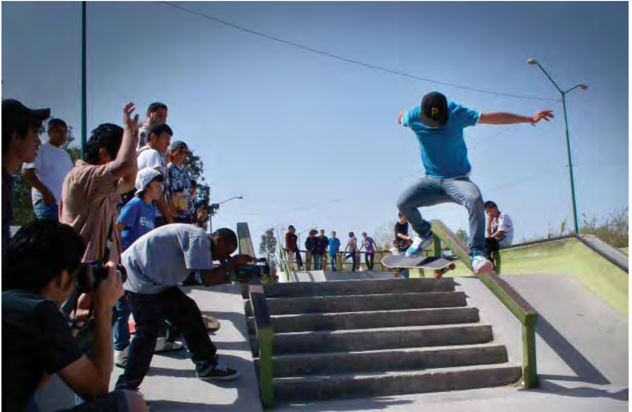
Tour Internacional de skateboarding Baja Banjin, Mexicali.

Para llevar a cabo este programa se designaron 21 gimnasios distribuidos estratégicamente en la ciudad, el Valle y San Felipe, a los cuales se les dotó de material deportivo, apoyos económicos y capacitación a los entrenadores, con una inversión de 1 millón 750 mil pesos.