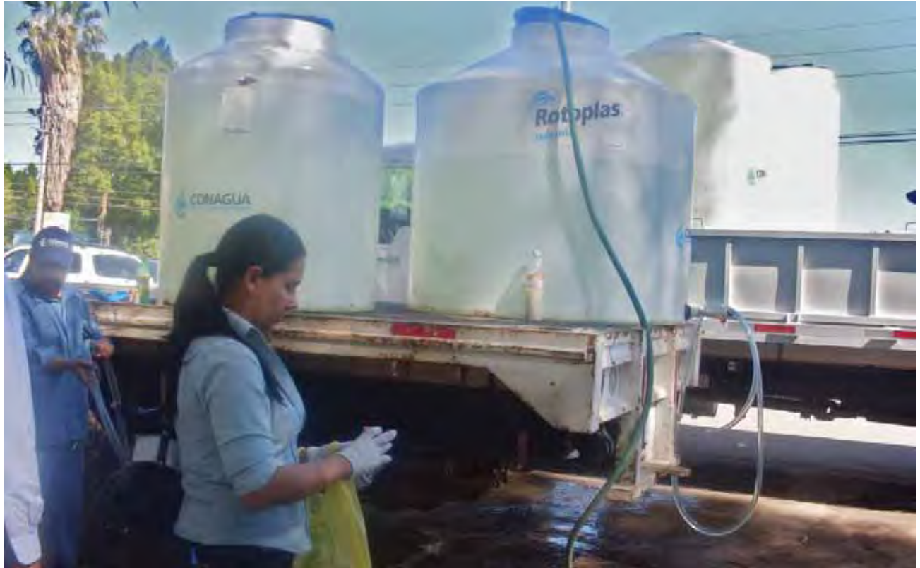
Monitoreo y evaluación a sistema de abastecimiento de agua.

Asimismo, se entregaron 150 equipos de monitoreo de cloro, se realizaron 20 mil 457 monitoreos y 34 visitas de evaluación a sistemas de abastecimiento. La eficiencia de desinfección promedio anual fue de 93.9% con una cobertura de 94%.