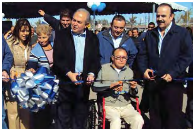
Evento de inauguración de obra, vía coordinación Interinstitucional, Mexicali.

Con la celebración de estos instrumentos, los tres órdenes de gobiernos coordinan acciones y recursos. Además, establecen compromisos y obligaciones a través de un esfuerzo conjunto, complementario y corresponsable en materia de superación de la pobreza y marginación, canalizando para ello más de 424 millones 358 mil pesos en obras de infraestructura social y servicios a través de los programas "Hábitat", "Rescate de Espacios Públicos",