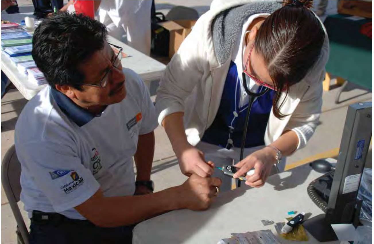
Prevención de enfermedades crónico degenerativas.