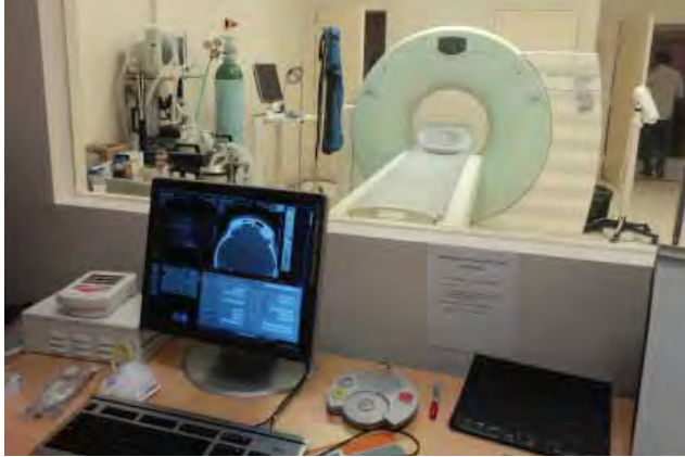
Tomógrafo del Hospital General de Tijuana.

En este mismo periodo, se destinaron 2 millones 500 mil pesos en la rehabilitación y ampliación de consultorios de medicina general, servicio dental y área administrativa en la Clínica Palmas de la ciudad de Tijuana.