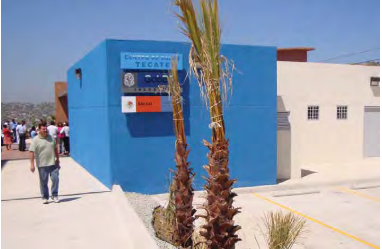
Centro de Salud, Tecate.

Para garantizar el flujo de información en la red de servicios, el proyecto del expediente clínico electrónico del ISESALUD, destinó en su primera etapa 42 millones 938 mil pesos en la adquisición de infraestructura para establecer un núcleo funcional de almacenamiento con capacidad de administrar la historia clínica digitalizada de cada paciente.