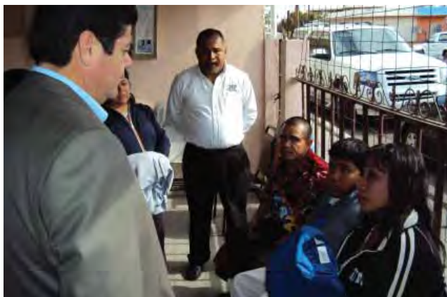
Coordinación interinstitucional en la atención a indígenas y migrantes.

de Mexicali. En las comunidades indígenas originarias de Baja California como son El Mayor Cucapá, Juntas de Nejí, La Huerta, San José de la Zorra, Santa Catarina y San Antonio Necua, se efectuaron talleres con los temas de etnobotánica (Infantil), artesanía, danzas y cantos indígenas, lotería indígena, entre otros.