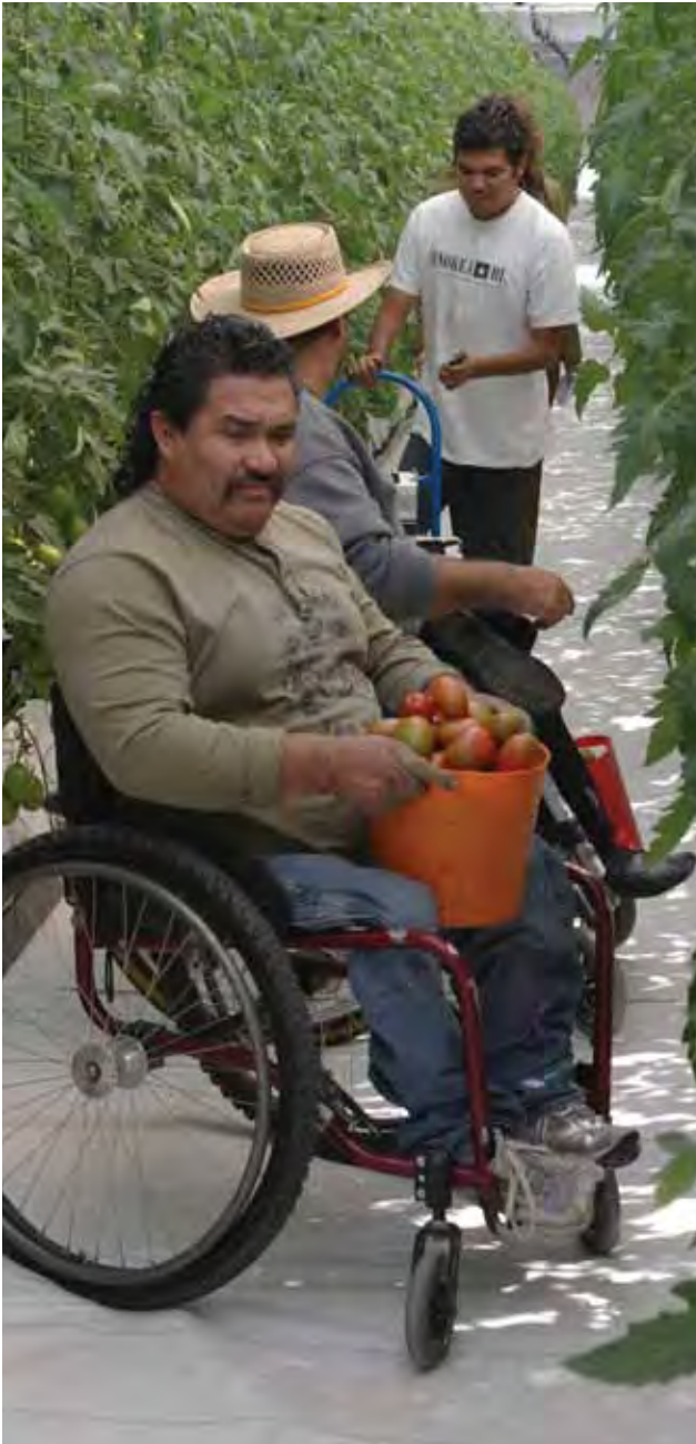
Beneficiados con el "Programa de Proyectos Productivos".