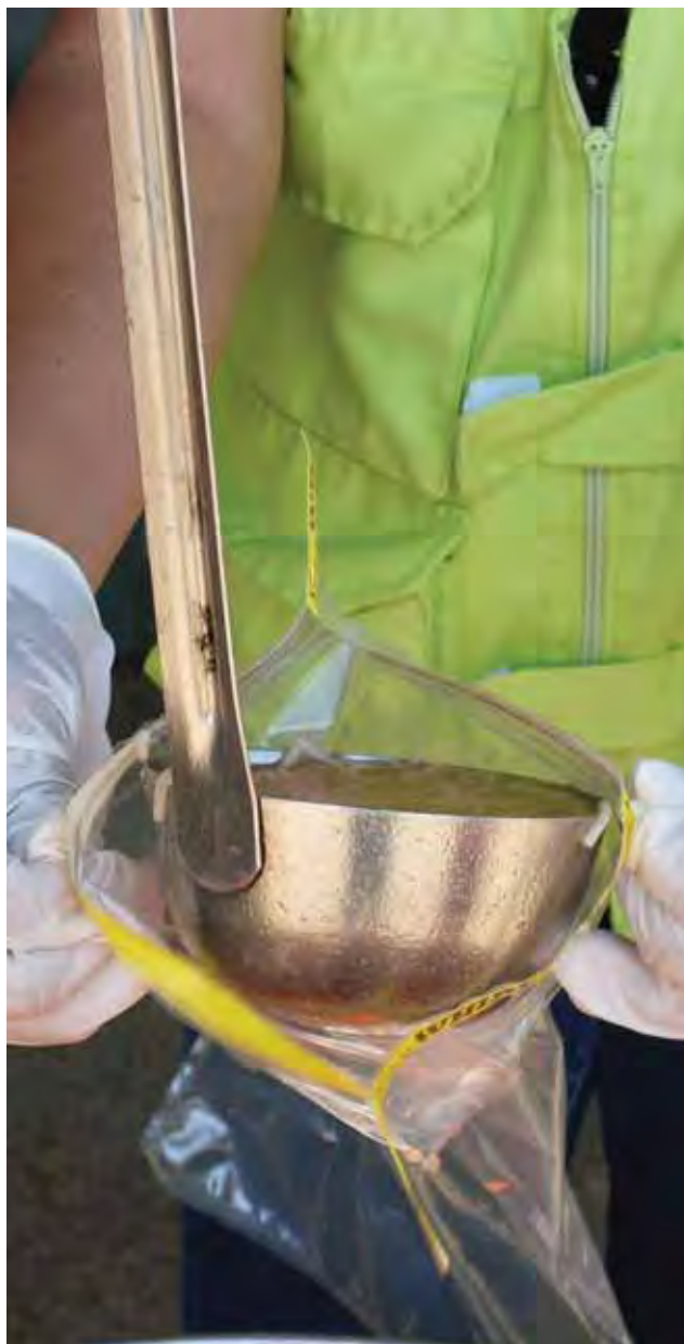
Toma de muestras para inocuidad alimentaria.

En lo que se refiere a trámites de servicios de salud, en este periodo se recibieron 353 avisos de funcionamiento, 327 avisos de responsable, 32 trámites para licencia sanitaria y 10 permisos de construcción para hospitales.