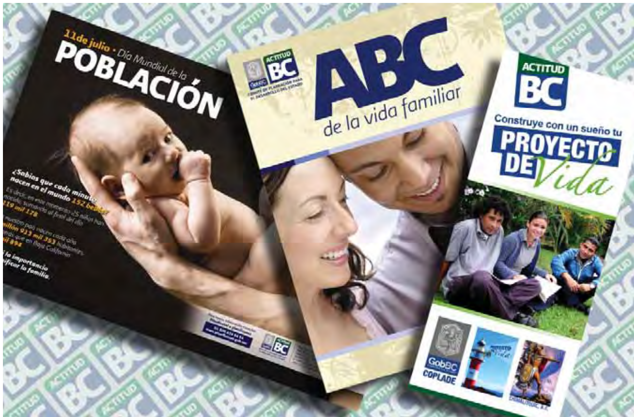
Difusión de información sociodemográfica del Estado.

busca impulsar en los niños y jóvenes bajacalifornianos los temas demográficos. En este importante evento participaron 197 trabajos en las diferentes categorías que lo integran.