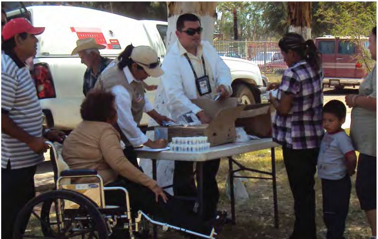
Acciones de participación comunitaria.

En continuidad con el convenio firmado con la Universidad Tecnológica de Tijuana con el propósito de profesionalizar y certificar en competencias a promotores institucionales y comunitarios, en el presente ejercicio se impartió el segundo módulo del diplomado “Aplicación de estrategias profesionales en el desarrollo social” a 72 promotores.