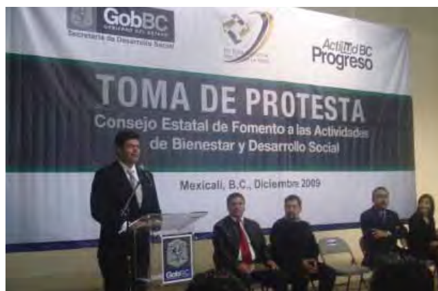
Toma de protesta del Consejo, Mexicali.

Actualmente, se desarrolla un mecanismo de certificación para los OSC's acorde con la realidad y necesidades de Baja California, dentro del cual se establecerán indicadores de calidad, y se contará con un grupo de expertos que integrarán el Consejo Certificador.