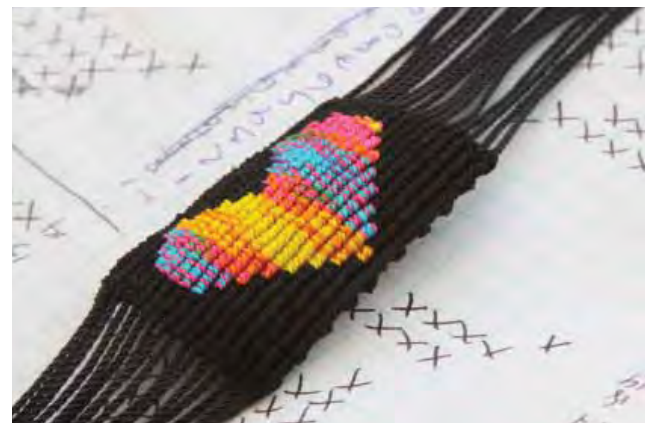
Manualidades elaboradas por indígenas.

Además, se realizaron talleres de enseñanza de la lengua indígena para niños y adultos en Ensenada y en las comunidades Kumiai, Pai-pai y Cucapah del Municipio