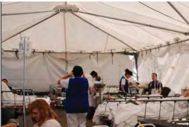
Atención médica en contingencia sísmica, Mexicali.

A través de 14 caravanas con personal médico, de enfermería y de promoción de la salud, se proporcionaron 955 consultas, se aplicaron 451 vacunas y se impartieron 74 pláticas para la prevención de enfermedades diarreicas, infecciones respiratorias y saneamiento básico. Asimismo, se entregaron tratamientos antiparasitarios y sobres de Vida Suero Oral a 650 familias.