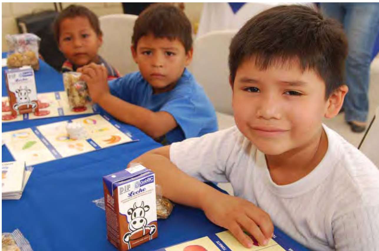
Beneficiados con el "Programa de Asistencia Alimentaria", Mexicali.