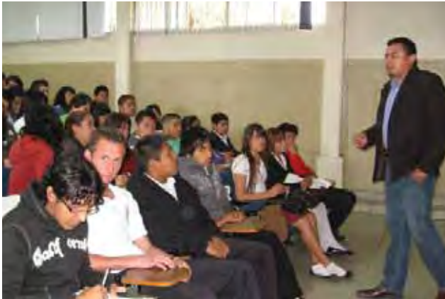
Alumnos asistentes a cursos de adicciones, Tijuana.

asistencia de tres mil 630 personas. Buscar formas creativas y atractivas para transmitir mensajes de promoción de valores fue la plataforma para crear la obra de teatro guiñol “Una granja diferente”, donde personajes que resultan muy atractivos comparten con los niños de preescolar y primaria, diversos conceptos relacionados con la familia, los valores y los buenos hábitos. En este primer ciclo de implementación se han realizado dos mil 168 funciones, en beneficio de 214 mil 289 niños y niñas.