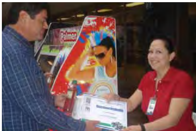
Beneficiada con proyecto productivo, Tijuana.

De igual forma, la guardería del Club de Niños y Niñas de México, A.C., atiende a más de 700 niños y niñas que requieren de este importante servicio. Para este periodo, el Poder Ejecutivo aportó 400 mil pesos para