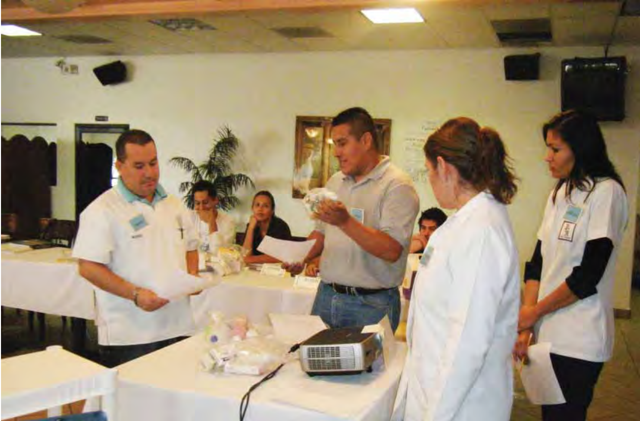
Capacitación en manejo de medicamentos en farmacias.