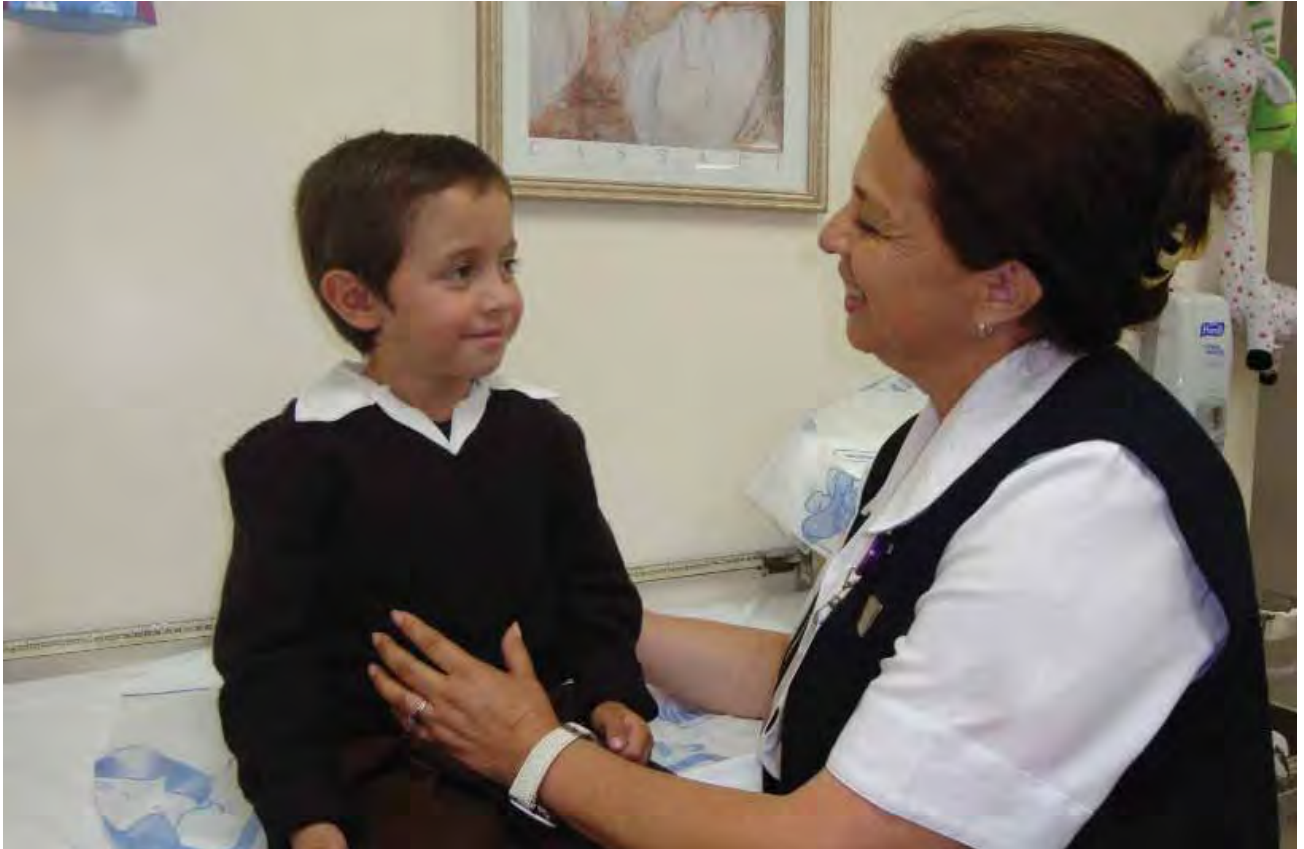
Calidad y seguridad en los servicios de salud.

Lo anterior ha requerido realizar modificaciones a los procedimientos para la planeación del abasto, monitoreo del inventario de claves críticas y el nivel de surtimiento de claves en las farmacias, así como ajustes al plan de abasto ante demandas extraordinarias; además de instrumentar farmacias para la dispensación conforme a políticas de manejo especializado. El resultado de esta acción consistió el 86% de claves de medicamentos surtidos en recetas completas.