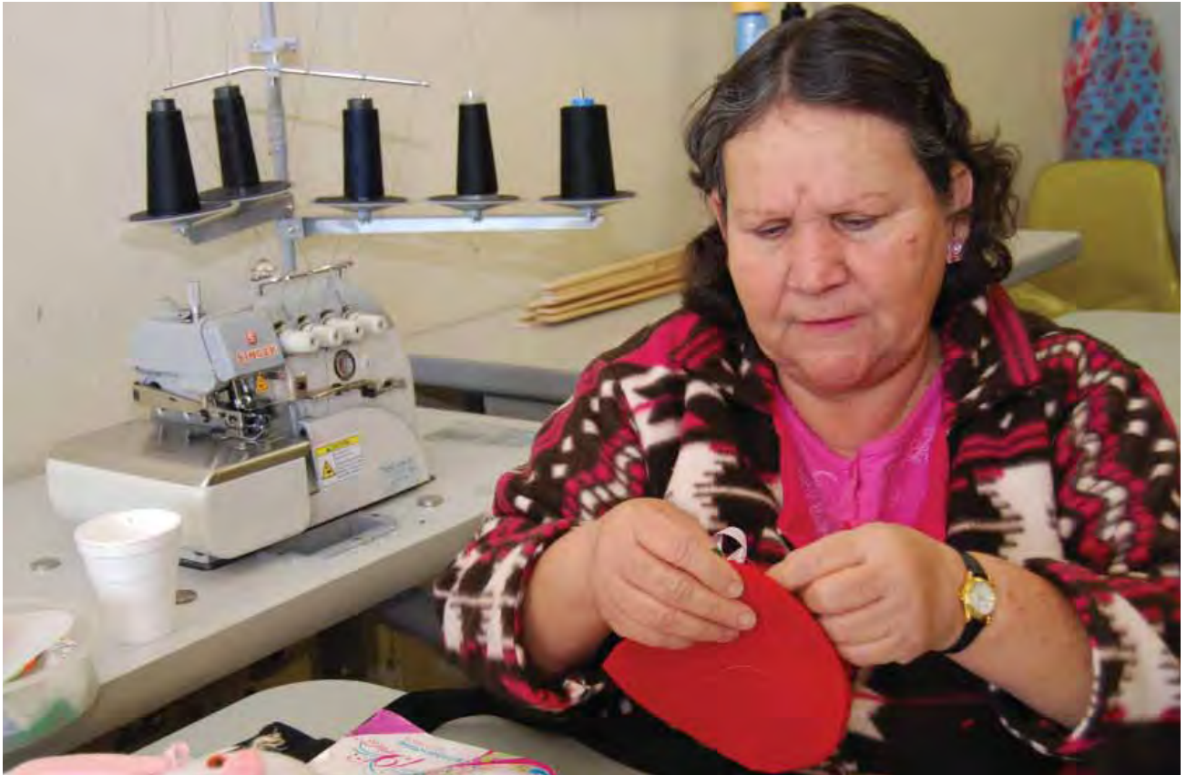
Capacitación a adultos mayores para el autoempleo.