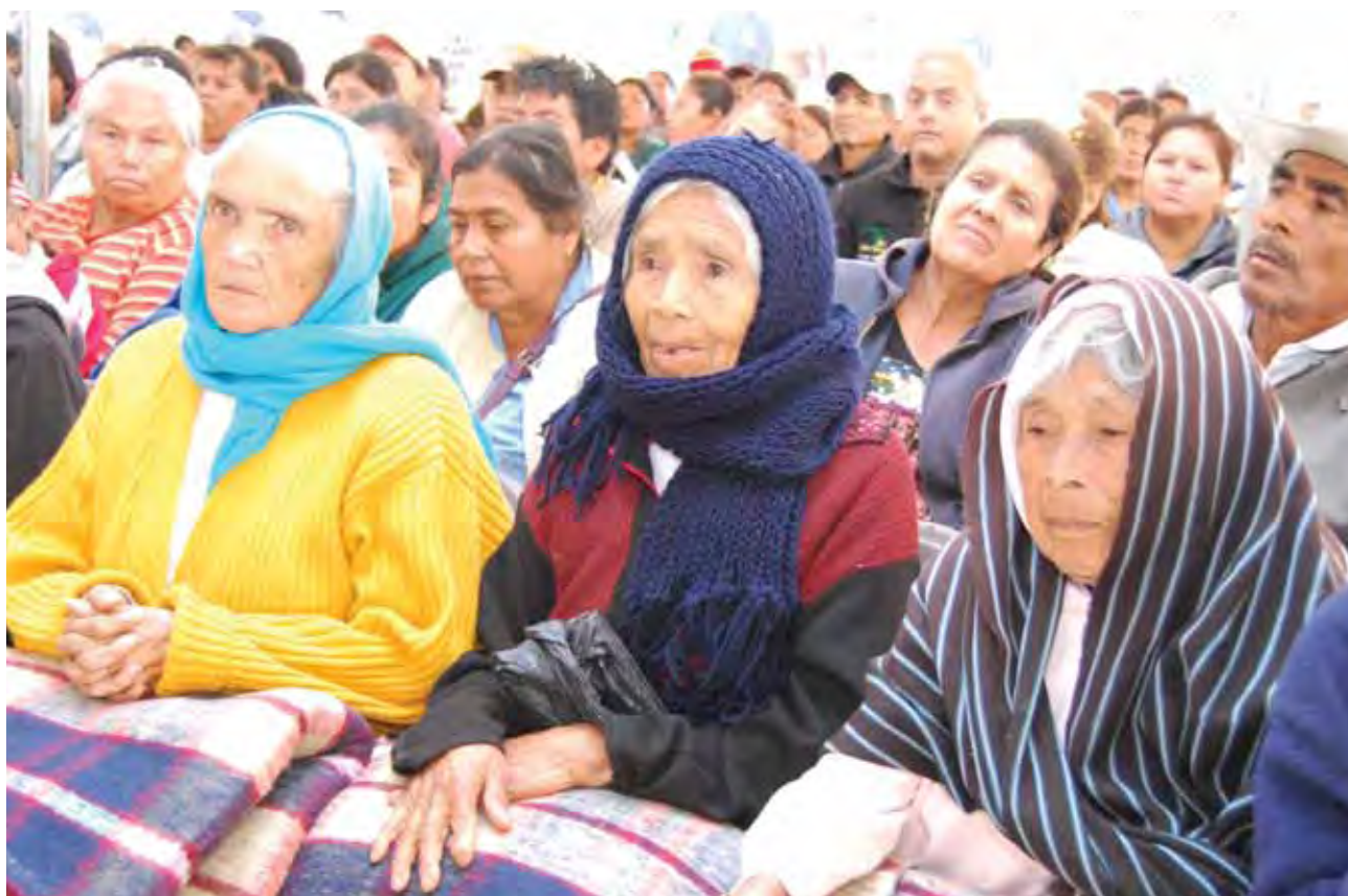
Beneficiados con acciones de asistencia social, Mexicali.

literas, colchones y lockers para dar una atención integral a hombres adultos con problemas de adicciones en proceso de rehabilitación en la Delegación la Mesa, Municipio de Tijuana” y “Beneficiar 60 hombres con problemas de adicciones con un taller vocacional para mejorar su calidad de vida en San Quintín”, entre otros.