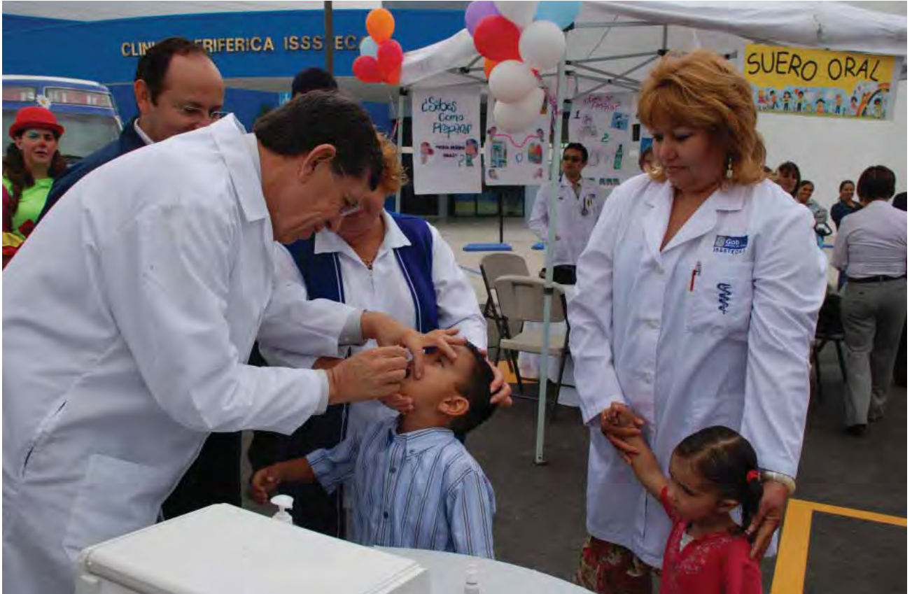
Aplicación de vacunas durante la Semana Nacional de Vacunación, Mexicali.

se mantenga libre de casos de poliomielitis, sarampión y difteria, todas ellas consideradas enfermedades prevenibles por vacunación.