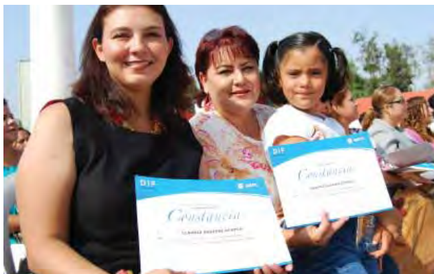
Asistentes a pláticas de escuela de padres, Mexicali.

Todos aquellos padres de familia, niños, adolescentes y jóvenes que son detectados como casos críticos en los diversos programas, son canalizados al "Programa de Orientación y Atención Psicológica" que comprende terapia individual, grupal y familiar. Con este valioso instrumento se atendió y apoyó a familias con problemas relacionados con tendencias suicidas, embarazos en adolescentes, adicciones, depresión y deserción escolar. En este periodo que se informa se brindó ayuda a cinco mil 715 personas a través de tres mil 195 terapias psicológicas de tipo individual, grupal y familiar.