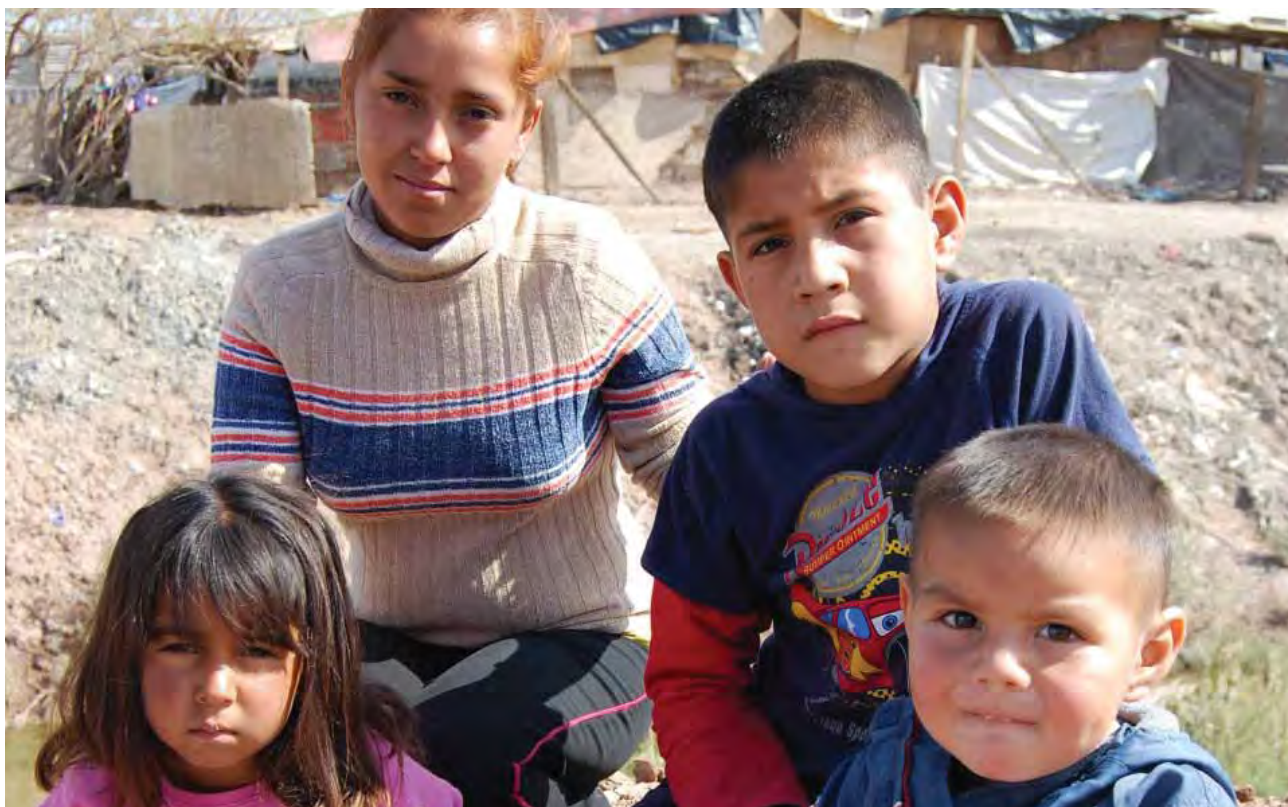
Atención integral a migrantes.

Asimismo, se dio a conocer el manual de participación infantil y se promovió la integración de cuatro redes conformadas por 53 niños difusores que desarrollaron cuatro proyectos para difundir, ejercer y promover sus derechos entre sus familiares, compañeros, autoridades escolares y en su comunidad. Esto se llevó a cabo mediante 17 acciones como campañas, pláticas, carteles, volantes, pintas de barda, murales, obras de teatro, entre otras, lo que benefició a 230 niñas y niños bajacalifornianos.