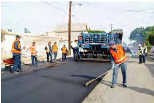
Pavimentación de calle San Felipe, Playas de Tijuana.

Derivado de los resultados que se han obtenido en materia de obra pública en la entidad, el Ejecutivo Estatal continuó impulsando la realización de pequeñas grandes obras comunitarias que contribuyen al mejoramiento del entorno en el cual se desarrollan los bajacalifornianos. Sin duda, el éxito de este programa se debe a la entusiasta participación social comunitaria que se ha involucrado