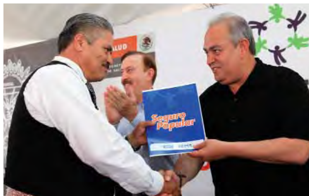
Entrega de poliza del Seguro Popular, Mexicali.

Parte importante para su articulación y operación, es contar con un sistema de información fortalecido y homogéneo, por lo que, por acuerdo del Consejo Estatal de Salud se iniciaron los trabajos para desarrollar el Sistema Estatal de Información Estratégica en Salud (SEIES), que de manera sectorial integre la información de los principales indicadores de salud.