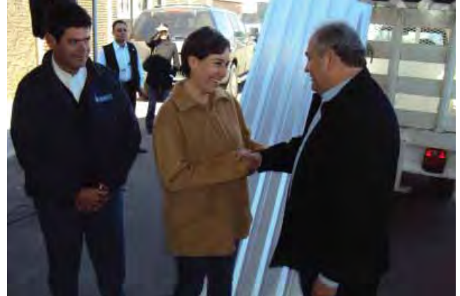
Entrega de material para dignificación de la vivienda.

El Gobierno del Estado de Baja California continuando con el objetivo de disminuir el rezago social de la población con pobreza patrimonial y con los diferentes