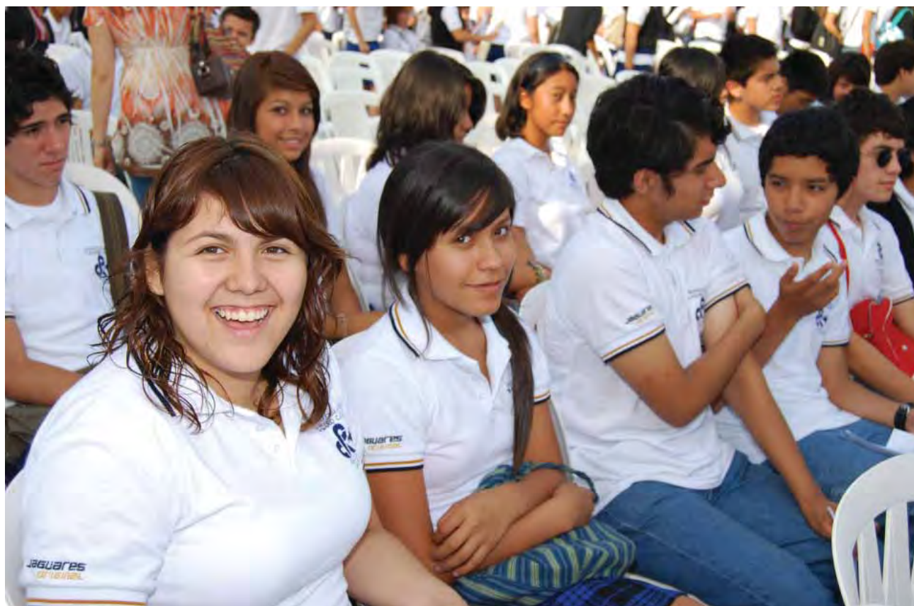
Jóvenes beneficiados con estímulos educativos, Tijuana.

permitieron observar la inclusión de la perspectiva de género en la política pública de Baja California. También, se elaboró un diagnóstico de las mujeres con adicciones en los centros de rehabilitación del Estado, lo que dio a conocer la situación actual y generar líneas de acción y estrategias para impulsar un diseño de política pública que atienda esta problemática en este importante sector.