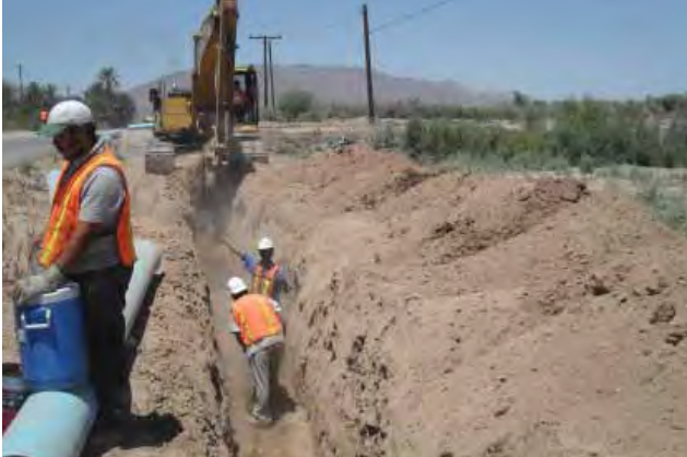
Instalación de red de agua potable, Valle de Mexicali.

“Empleo Temporal”, “Opciones Productivas”, “Desarrollo de Zonas de Atención Prioritarias”, “Jornaleros Agrícolas”, “Coinversión Social” y “Pueblos y Comunidades Indígenas”.