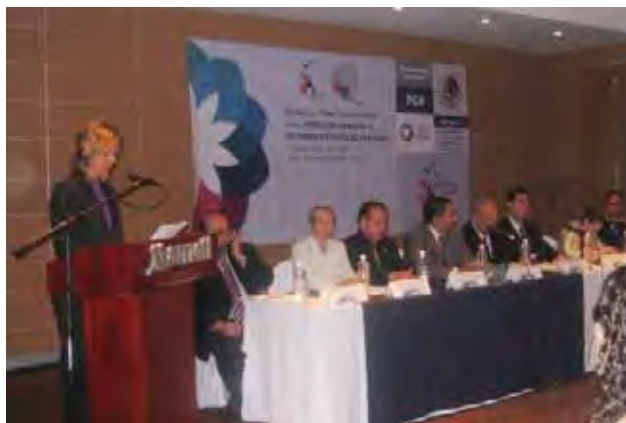
Foro sobre la atención a víctimas de trata de personas, Tijuana.