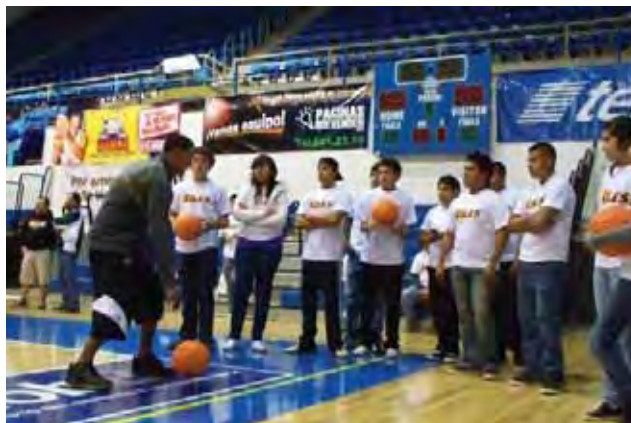
Participantes en la campaña "Juguemos Limpio, Mexicali.

A través de un equipo multidisciplinario enfocado a mejorar las condiciones de vida y convivencia de los integrantes de la familia, se impartieron 149 talleres de "Transformación de vida" en 43 escuelas, con una