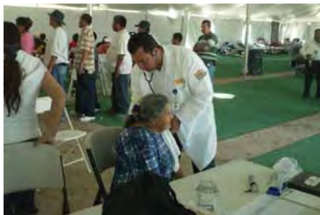
Acciones de prevención y atención de enfermedades, Valle de Mexicali.

Ensenada enfrentó contingencia ambiental por lluvias torrenciales a finales de enero de este año; fue declarado como zona de emergencia por los estragos causados. Al respecto, la Secretaría de Salud Estatal en coordinación con la Comisión Nacional del Agua (CONAGUA), el XIX Ayuntamiento de Ensenada y el Sistema DIF Estatal, realizaron acciones de asistencia, control sanitario, prevención y atención de enfermedades en siete delegaciones con un total de 57 localidades afectadas en la zona de San Quintín, donde recibieron atención dos mil 589 personas en los 11 albergues habilitados.