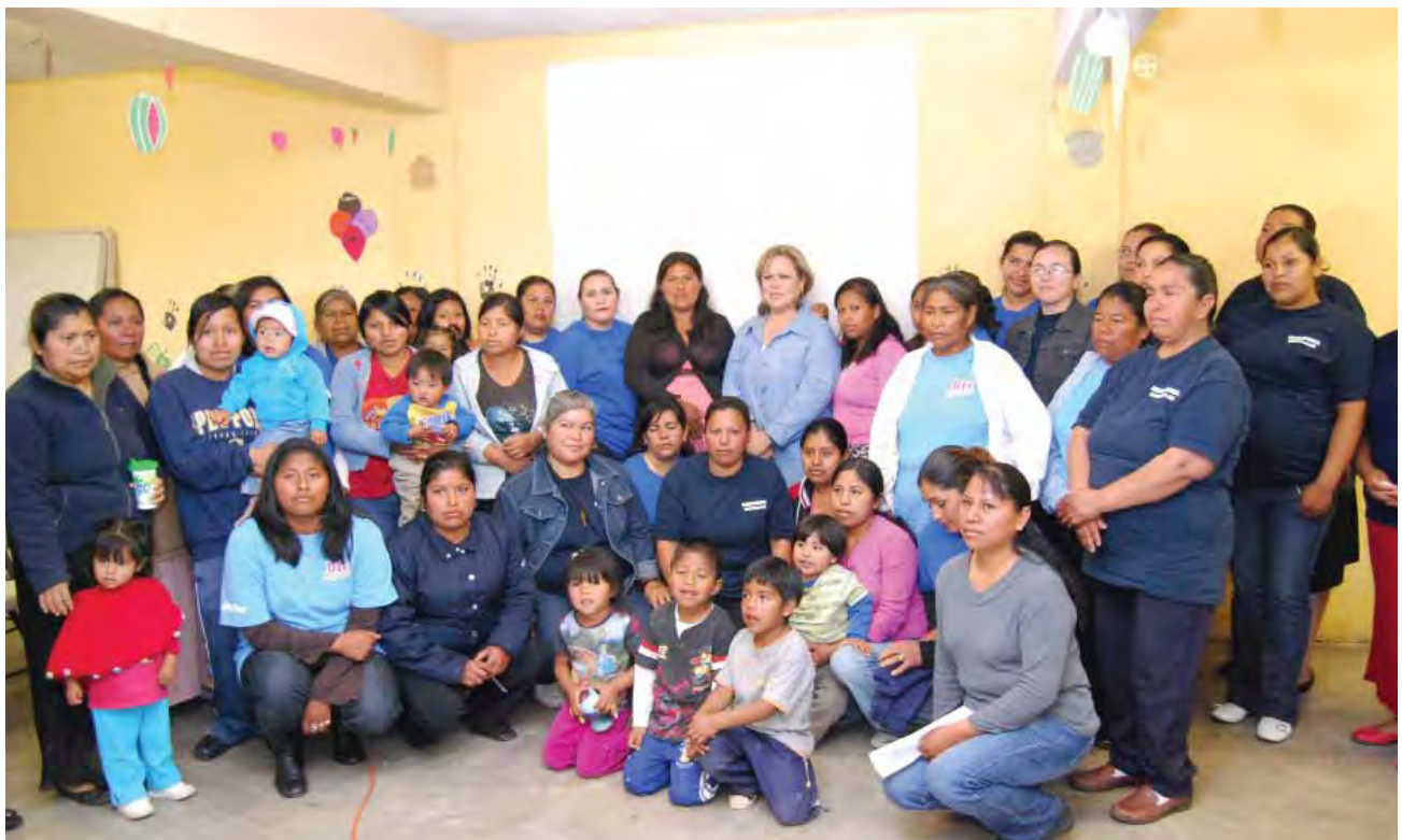
Grupos de desarrollo comunitario en beneficio de la comunidad del Valle de San Quintín.

Por medio del “Programa de Desarrollo Comunitario” se promovió la integración de 11 grupos de desarrollo que realizaron 67 acciones encaminadas a identificar necesidades y problemáticas de su comunidad, además de elaborar proyectos comunitarios que beneficiaron a un mil 814 personas que viven en las localidades de mayor índice de vulnerabilidad, como son el Valle de San Quintín, Vicente Guerrero, Lázaro Cárdenas, Camalú y Vicente Ferrer.