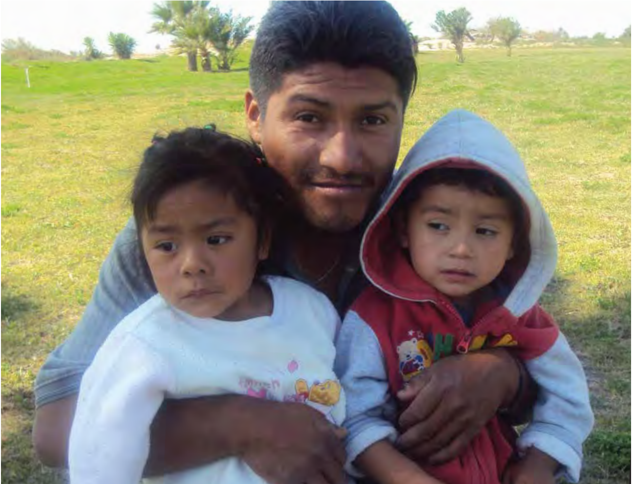
Beneficiados con el "Programa de Fondo de Apoyo a Migrantes".

de Trata de Personas en el cual participan las diferentes instancias del gobierno federal, estatal y municipal, así como los OSC's.