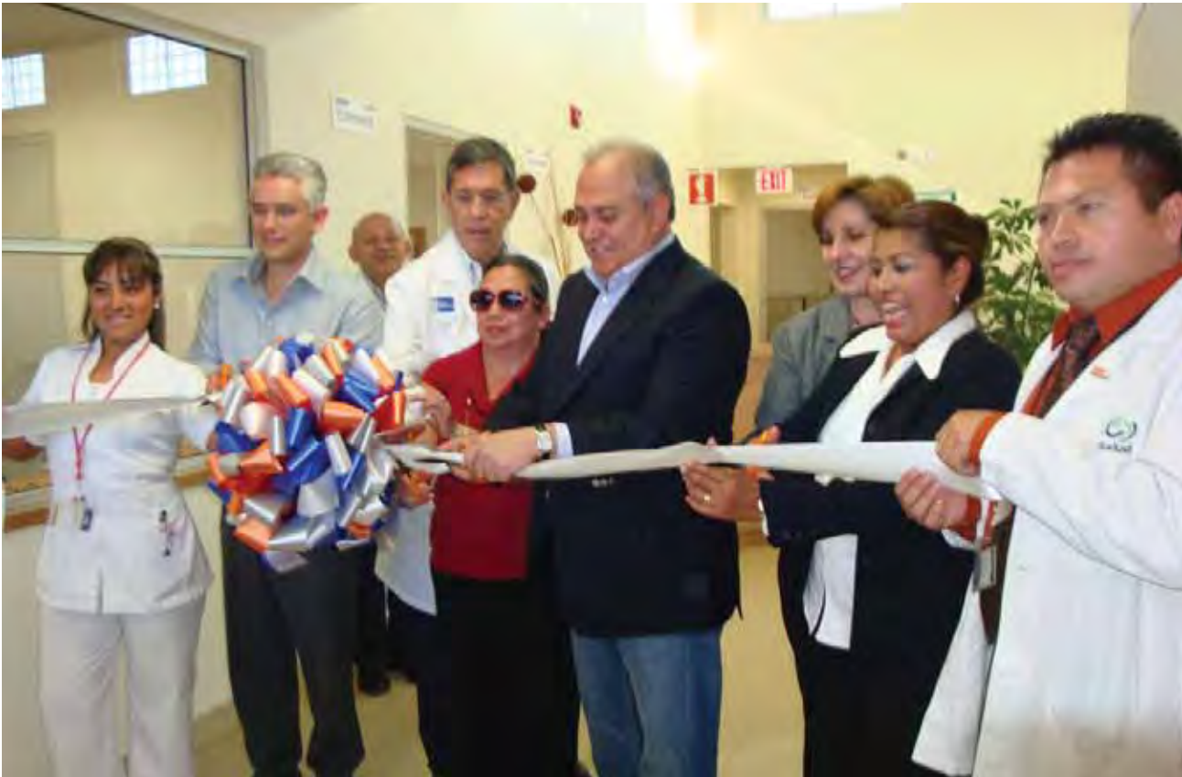
Inauguración del Centro de Salud Herrera, Tijuana.

Asimismo, se ampliaron y/o rehabilitaron las áreas pediátricas de urgencias y la de adultos; así como las de laboratorio e imagenología. Además, se construyó la sala de espera del servicio de urgencias.