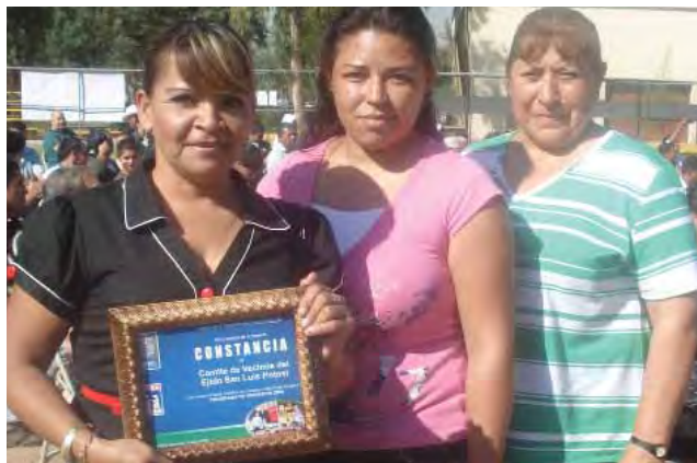
Comité ciudadano de participación social.

A través del "Programa de Rescate de Espacios Públicos", se constituyeron 190 ciudadanas y ciudadanos en 38 comités ciudadanos de participación social, cuyo objetivo es proponer y decidir las actividades a realizar, cumplir con las metas y acciones sociales programadas en su comunidad, así como mantener y conservar las instalaciones, el equipamiento y mobiliario urbano dentro del espacio público.