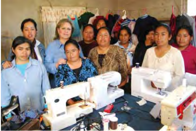
Beneficiadas con la entrega de proyecto productivo, Ensenada.