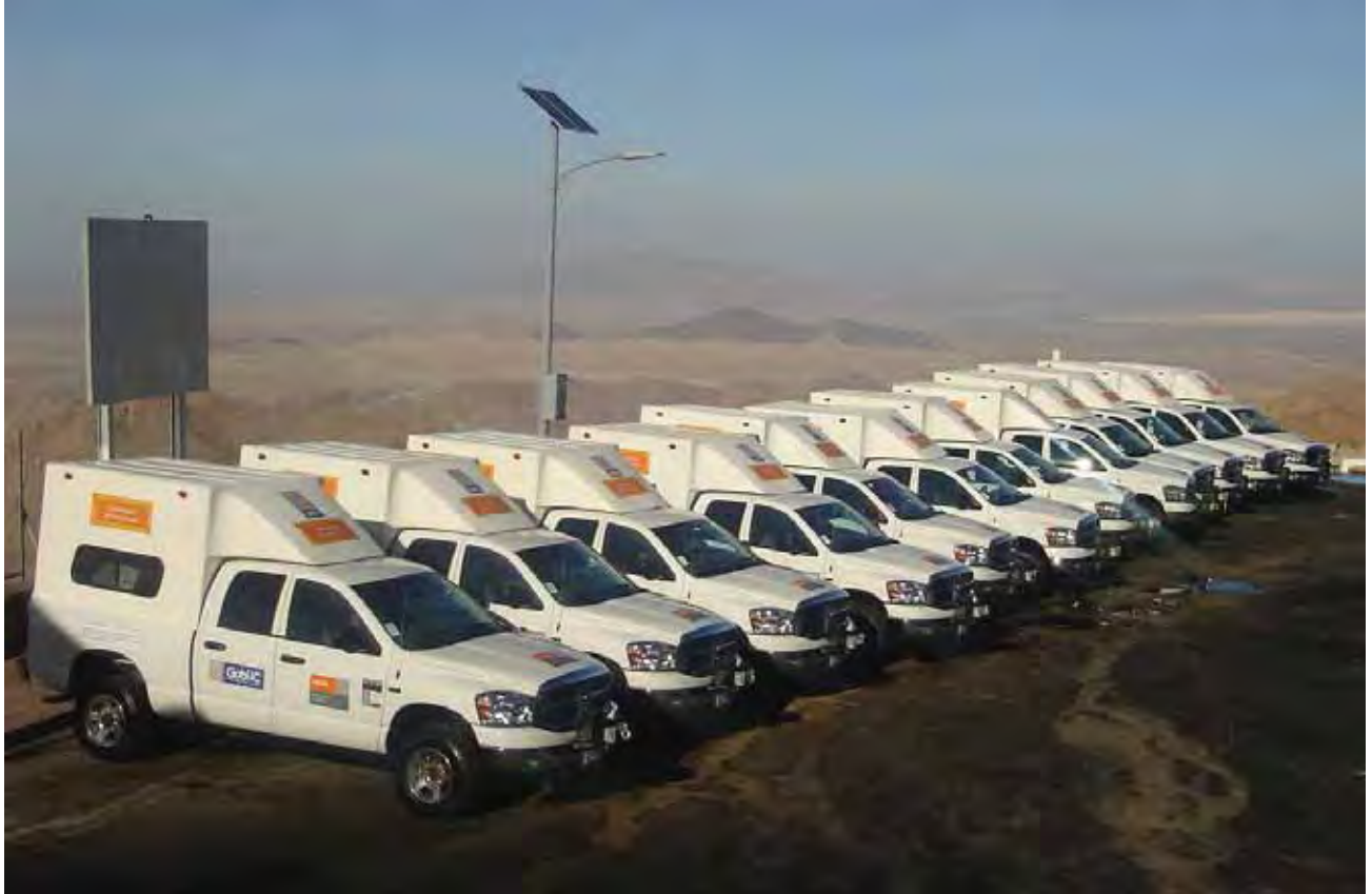
Caravanas de la salud para atender a la población vulnerable.

y seguimiento oportuno. En total se cubrieron un mil 755 localidades de difícil acceso, en beneficio de 582 mil 909 habitantes.