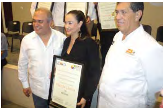
Reconocimiento a Baja California.

responsable de la capacitación e investigación sobre un esquema basado en evidencias científicas y con enfoque epidemiológico local. Actualmente, los proyectos de investigación son desarrollados por profesionales de la salud, incluidos los médicos residentes de las distintas especialidades y avalados por los comités de bioética de las unidades hospitalarias.